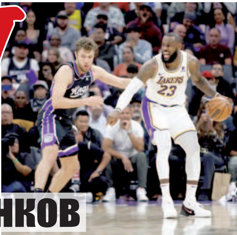
Александър Везенков се опитва да отнеме топката на Леброн Джеймс при победата на Сакраменто над Лейкърс в Лос Анджелис

Победата изведе "Кралете" на върха в Тихоокеанската дивизия с актив 6-4. Следват Лейкърс и Голдън Стейт Уорриърс с по 6-6, Финикс е с 5-6, а ЛА Клипърс - с 3-7.