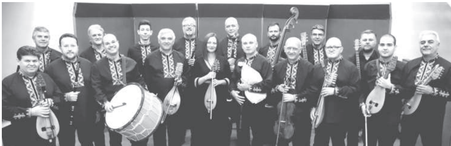
Оркестърът за народна музика на БНР

Концерт на Оркестъра за народна музика на БНР с Хор "Мистерията на българските гласове"