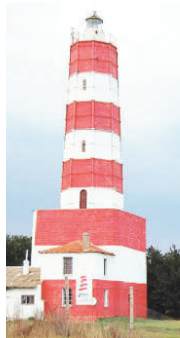
Фарът в Шабла