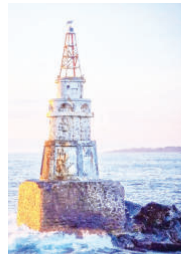
Фарът в Ахтопол

Ограниченията на чисто визуалната навигация довели до идеята за допълнително звуково предупреждение. В началото за целта били използвани оръдия, а по-късно - електрически детонирани експлозивни заряди.