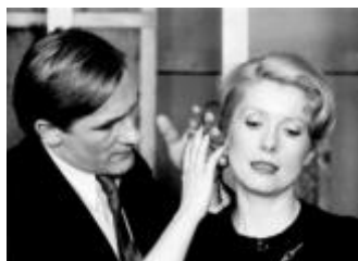
"Последното метро" - реж. Франсоа Трюфо

По традиция сред акцентите в програмата на 37-ото издание на "Киномания" (16 ноември - 3 декември) са на-