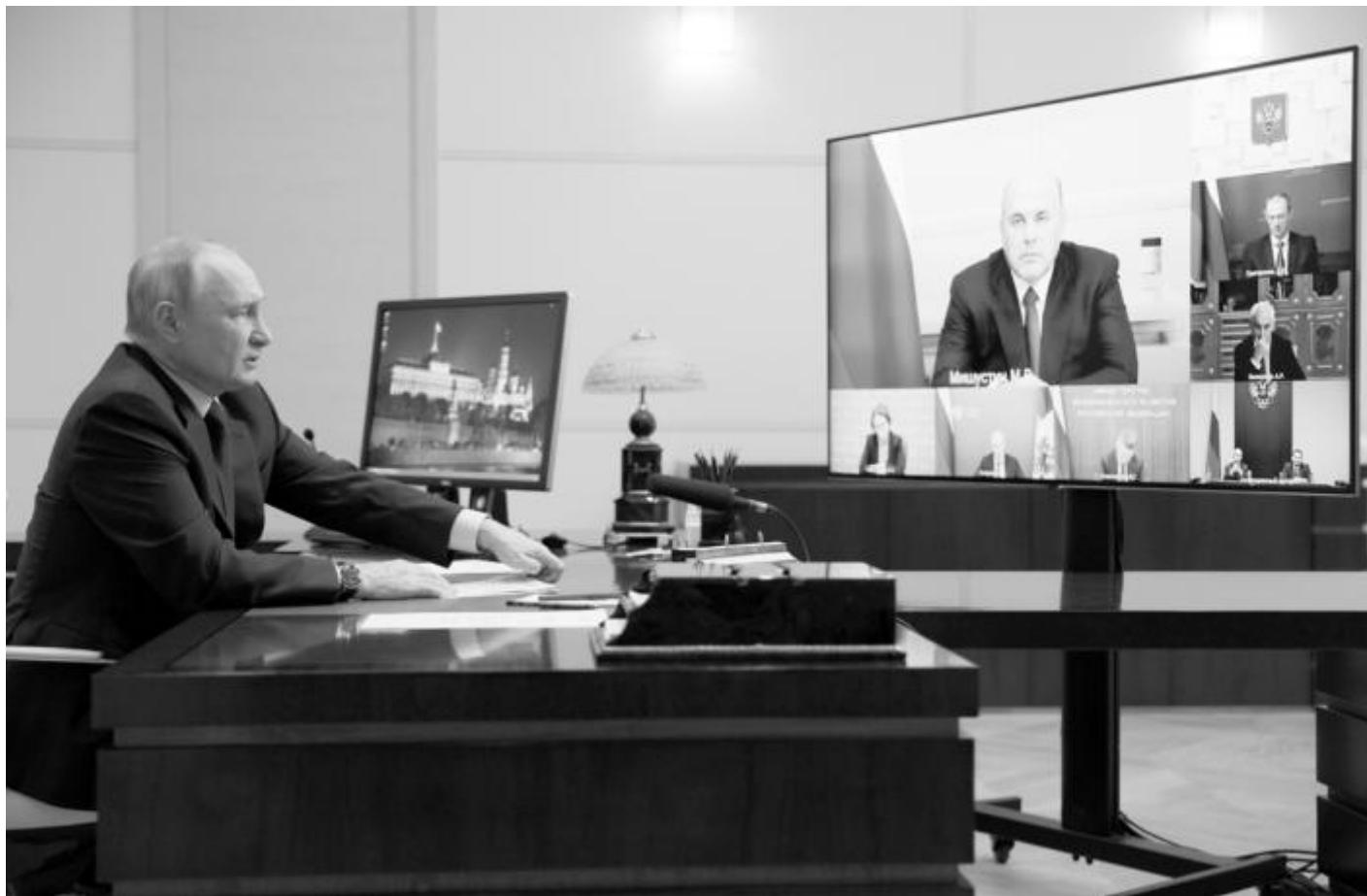
Кремъл публикува снимки от работно заседание, посветено на икономическите въпроси, с участието на президента на Русия Владимир Путин и премиера Михаил Мишустин. По този начин руските власти категорично опровергават появилите се в социални мрежи слухове, че държавният глава е починал