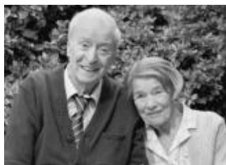
"Великият беглец" - реж. Оливър Паркър

По традиция сред акцентите в програмата на 37-ото издание на "Киномания" (16 ноември - 3 декември) са на-