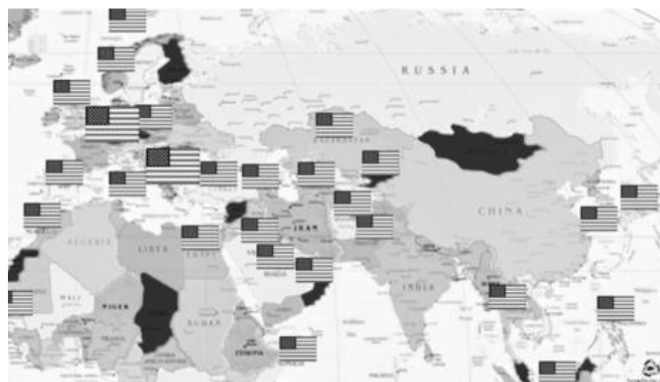
Така изглежда „агресивната Русия“ и американските бази около нея и по света!

Греъм Доналд се позовава на Чърчил, който в свои мемоари пише, че през пролетта на 1945 г. САЩ безнаказано са бомбардирани Япония, защото отбраната ѝ е била разбита. 9-месечната кампания на бомбардировки е избила около 580 000 цивилни японци и централните части на 66 японски града са били сринати до основи (при ядрените удари срещу Хиросима и Нагазаки загиват 330 000 цивилни японци). Нещо повече, през пролетта на 1945 г. Япония на два пъти изразява готовност да преговаря за безусловна капитулация (чрез Ватикана и Москва). От военна гледна точка не е имало нужда от атомните бомби, което се признавало и от висши военни на САЩ. Но както пише в книгата, ядрената бомбардировка е била предназначена за СССР. „Идеята на тогавашния държавен секретар Джеймс Бърнс била, че използването на бомбата би направило Русия по-контролируема“, обяснява Греъм Доналд. По-контролируема, защото тя е била по-слаба без ядрената бомба, с която се сдобива през 1949 г. Тоест 330 000-те загинали японци са цената, за да постигне американският Тразимах „справедливия“