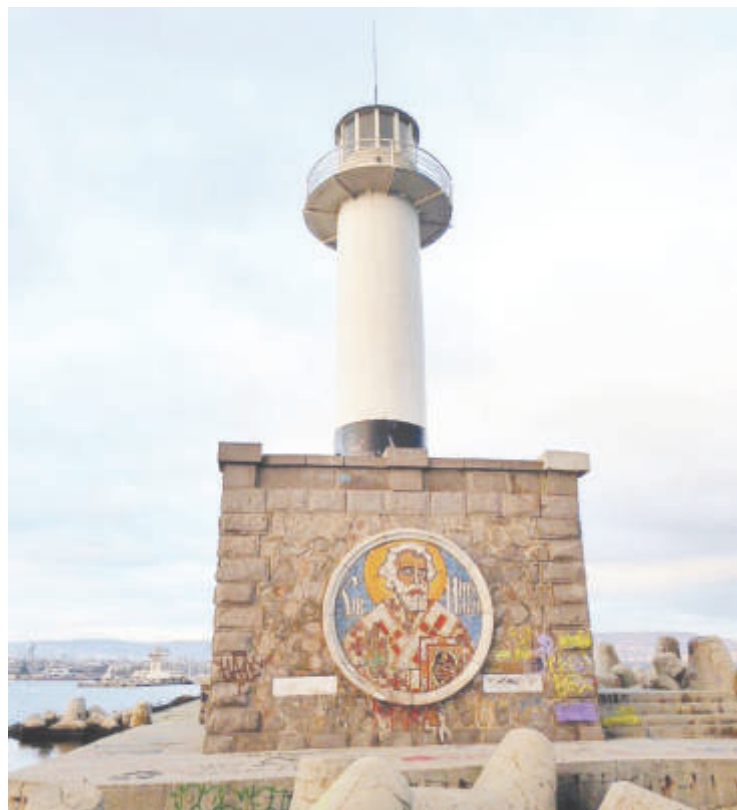
Фарът във Варна