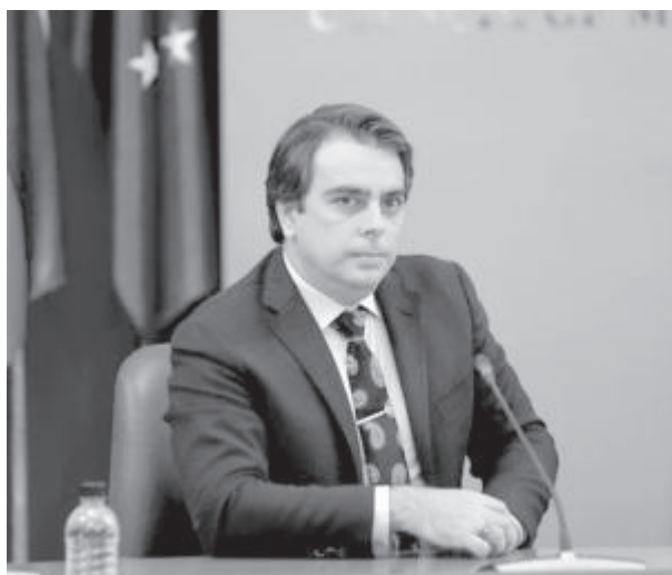
Въпреки заявките за запазване на данъчно-осигурителната тежест, финансовият министър Асен Василев предлага сериозно увеличение на данъците и осигуровките върху гражданските договори от 2024 г.

Новата тежест за държавния служител ще е около 11% само за държавното обществено осигуряване. В момента за неговите фондове личната вноска на "обикновените"