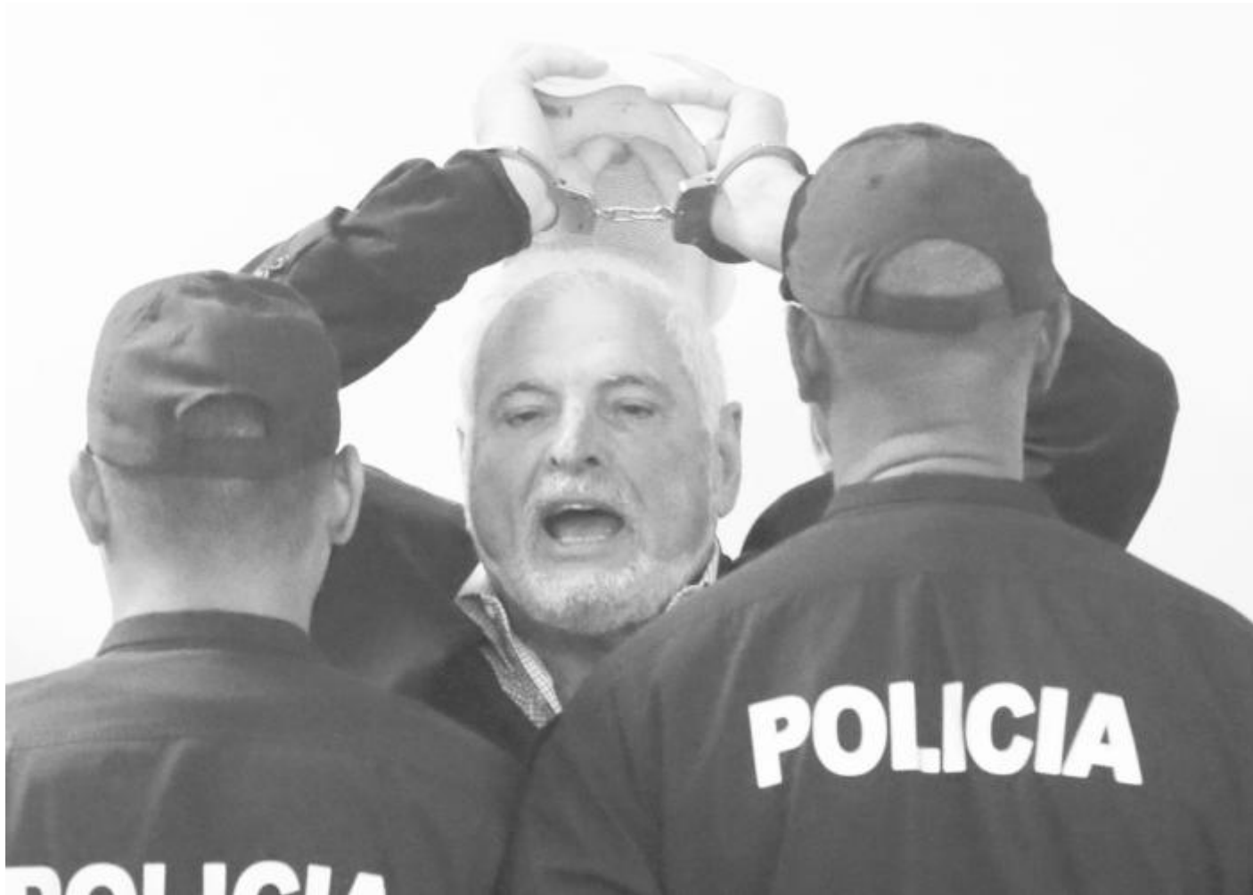
Бившият президент на Панама Рикардо Мартинели показва на журналисти белезниците на ръцете си. Върховният съд в страната потвърди 10-годишната му присъда за пране на пари