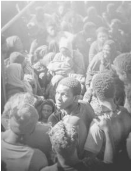
„Аз, капитанът“ - реж. Матео Гароне

на две сенегалски момчета, които мечтаят да емигрират в Италия. Според мотивацията на венецианското