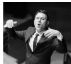
СНИМКА ДО ВАРНА

Премиера на книгата „Хорът и хорвият диригент в операта. Аспекти при работа с оперен хор“, София, 2023, от диригента на