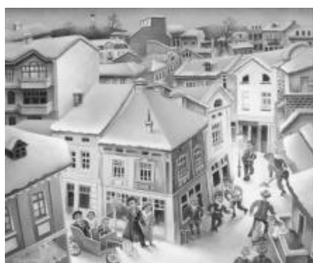
„Зима в Капана“

Изложбата може да се разгледа на живо до 30 октомври, както и онлайн в сайта на галерия „Париж“.