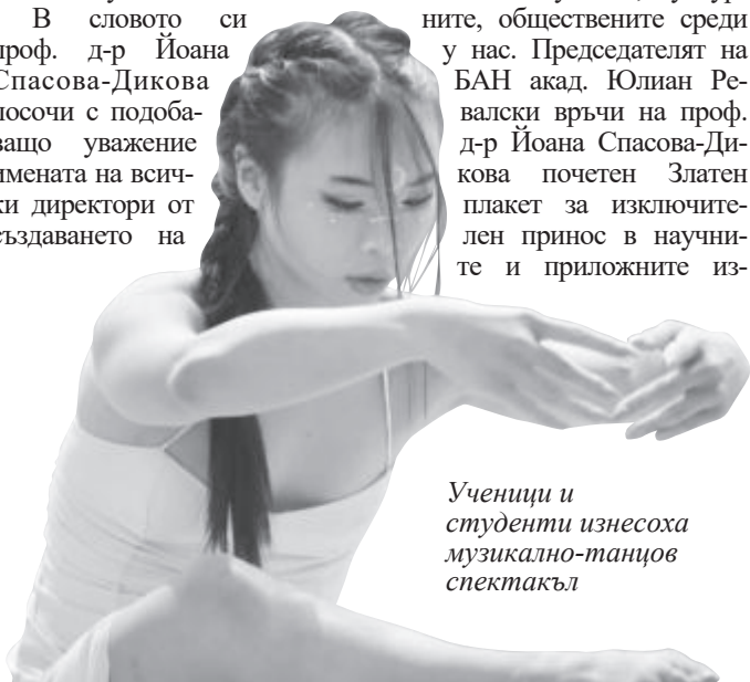
Ученици и студенти изнесоха музикално-танцов спектакъл

ДУМА изказва искрени съболезнования на семейството и близките на именития художник. Поклон!