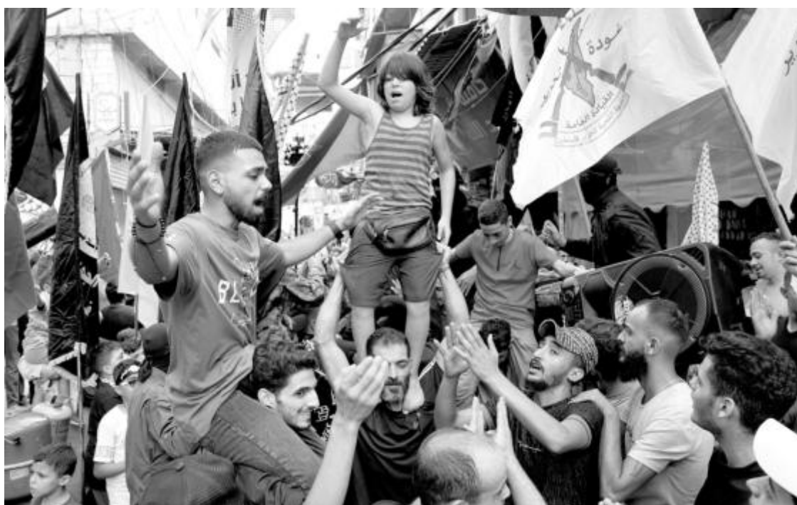
Палестинци, настанени в бежански лагер в ливанската столица Бейрут, се радват, че военната групировка „Хамас“ е нанесла удари по ивицата Газа. Атаките са били по въздух, вода и суша

ЕС и редица държави обявиха, че осъждат атаките на „Хамас“ и призовават за спиране на насилието. Първият дипломат на Евросъюза Жозеп Борел написа в социалната мрежа Екс: „Осъждаме недвусмислено атаките на „Хамас“. Това ужасяващо насилие трябва да бъде прекратено незабавно. Тероризмът и насилието не разрешават нищо“. Германия осъжда категорично терористичните атаки, идващи от Газа срещу Израел“, заяви външната министърка Аналена Бербок. „Потвърждаваме отново отхвърлянето на тероризма и привързаността си към сигурността на Израел“, се казва в изявление на френското външно министерство.