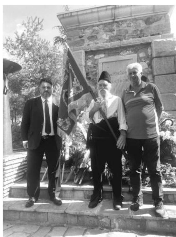
Зам.-председателят на БСП и на ПГ "БСП за България" Атанас Зафиров присъства на Националното тракийско поклонение. То е посветено на 110-тата годишнина от разорението на тракийските българи и 120 годишнината от Илинденско-Преображенското въстание. Заместник-председателят на БСП бе там по покана на съюза на тракийските дружества в България и община Маджарово

Отлага се пускането на е-рецептата за антибиотици и лекарства за диабет, съобщиха пък от Министерството на здравеопазването. Въвеждането на е-рецептата следва да бъде съобразено и с изискването и препоръките на Министерството на електронното управление за генериране на два Национални референтни номера - първият от тях при изписването на рецептата, а вторият при отпускането на лекарствения продукт.