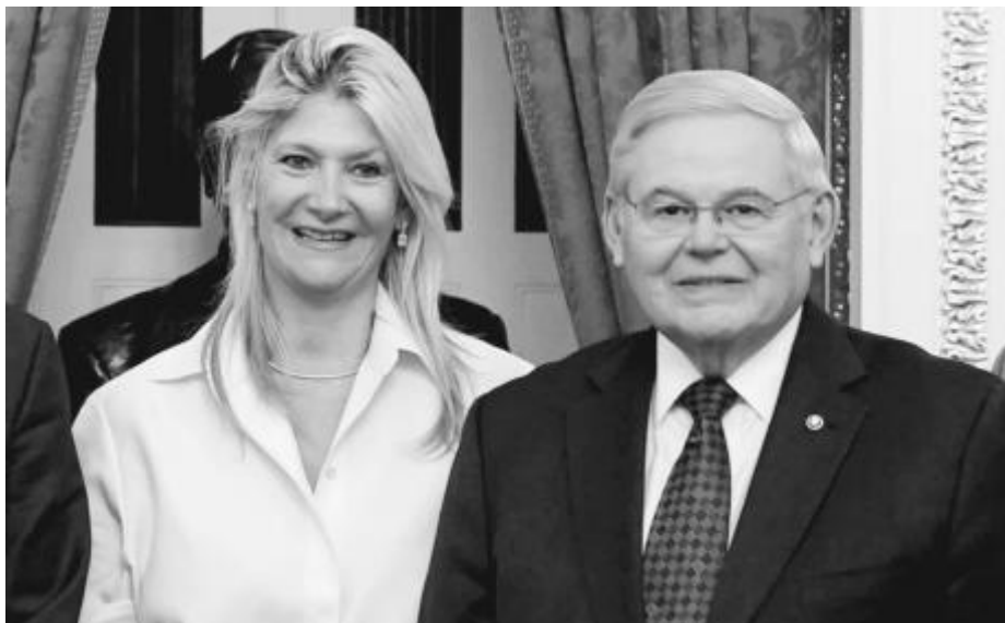
Сенатор Боб Менендес със съпругата му

Сенатор Менендес е син на кубински мигранти. Той обясни произхода на парите като стар кубински навик, насаден в семейството му от комуни-