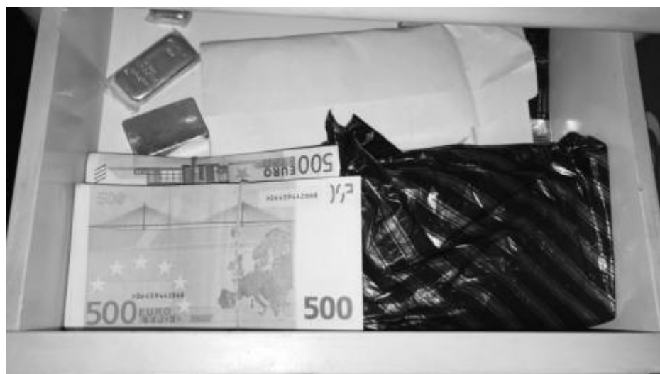
Всеки (български) оригинал...