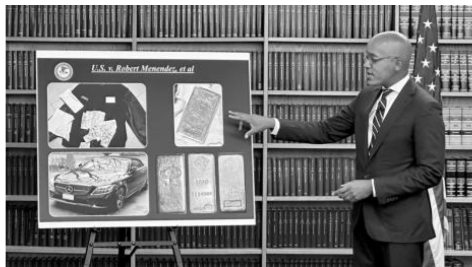
...има бледо (чуждестранно) копие