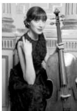
СНИМКИ СОФИЙСКА ФИЛХАРМОНИЯ

Тя - харизматично артистична млада звезда на виолончелото, която покорява със своя оптимизъм, жизненост и радостно излъчване. Тя е единствената дама виолончелист в групата на „Дойче грамофон“. През 2014 г. печели наградата за изгряваща звезда „Les Victoires de la Musique“ (френския