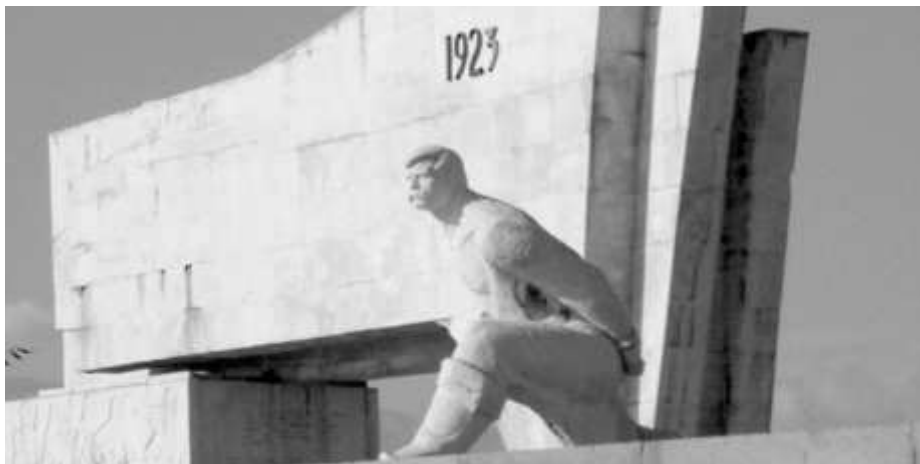
Въпреки опитите за пренаписване на историята паметниците за Септемврийското въстание все още стоят на своето място и хората помнят бурните събития

Наричаме този преврат фашистки поради използването на военна сила за вземане на законно избраната от народа