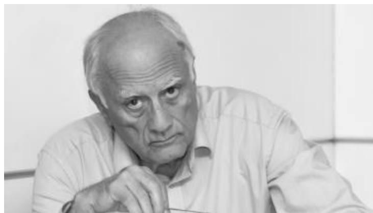
Проф. Петър-Емил Митев

и на политическия и икономическия "постмарксизъм", та чак до китайския марксизъм (някой от изследваните документи и досега не са достъпни на български език), всичко това е най-висококачествена "храна" за жадните млади леви хора в България (Петър-Емил Митев наистина я посвети на младите поколения български социалисти), като менното и съставките са нещо наистина модерно, заредено с "духа на левицата от XXI век". И защо