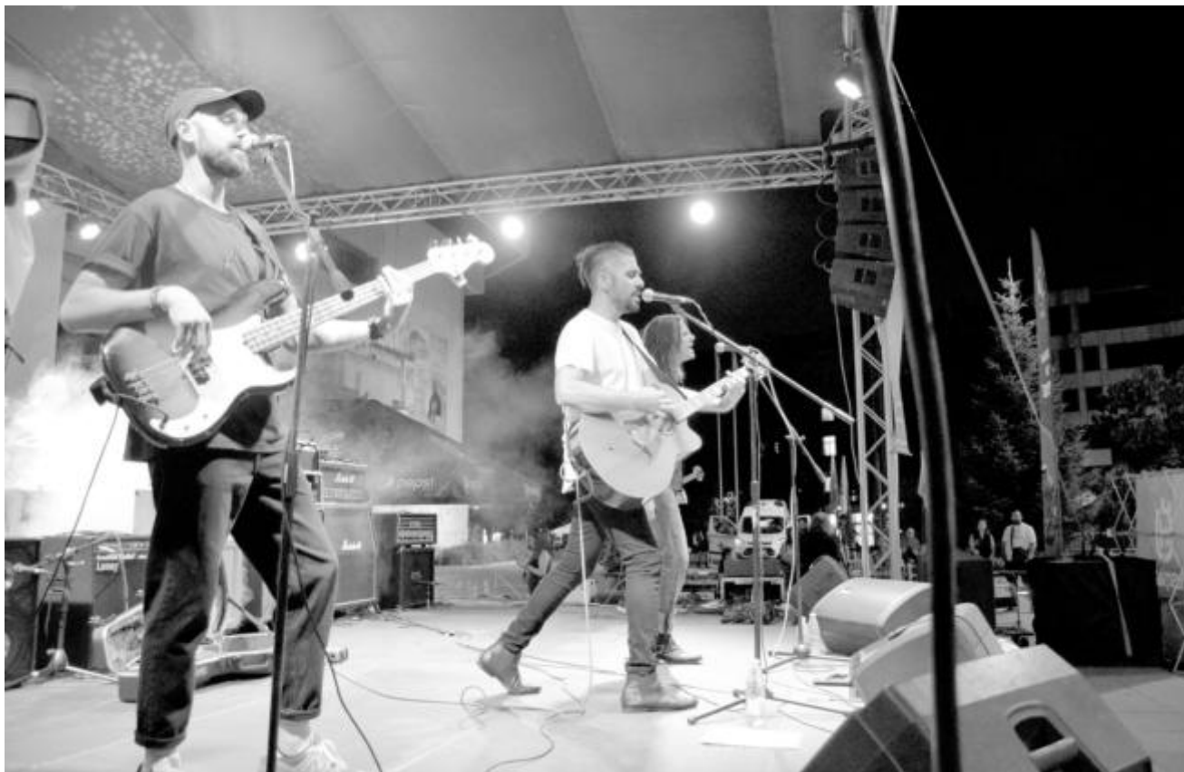
През уикенда Русе бе огласен от 15-ото издание на "Green Rock Fest". В продължение на два дни на сцената се извиха любими български групи и чуждестранни изпълнители. Събитието се осъществи по инициатива на сдружение "Грийн рок фест" с финансовата подкрепа на Община Русе, Общинска фондация "Русе - град на свободния дух" и спонсори

От Инспектората припомнят, че нямат правомощия да извършват преценка на правилността и законосъобразността на съдебните актове.