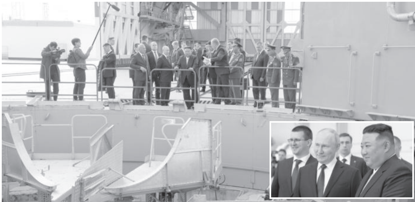
Владимир Путин и Ким Чен Ун оглеждат обект от космодрума "Восточний" в Амурска област. Момент от посрещането на лидера на КНДР (на малката снимка)