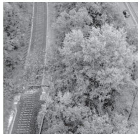
Аварийните служби реагираха мигновено, за да отстранят подпали дървета върху жп линии в предградие на Франкфурт, Германия. Районът бе ударен от силна буря в сряда през нощта

Новоизбраният президент на Зимбабве Емерсън Мнангагва положи клетва и назначи един от синовете си и един от племенниците си за заместник-министри. Кабинетът е съставен предимно от лоялни членове на управляващата партия ЗАНУ-ПФ. Според опозицията назначенията са "особено обезпокоителни".