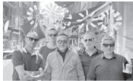
СНИМКА ГРУПА „ОСТАВА“

„Остава“ с нов видеоклип, дни преди концертите в Пловдив и Русе