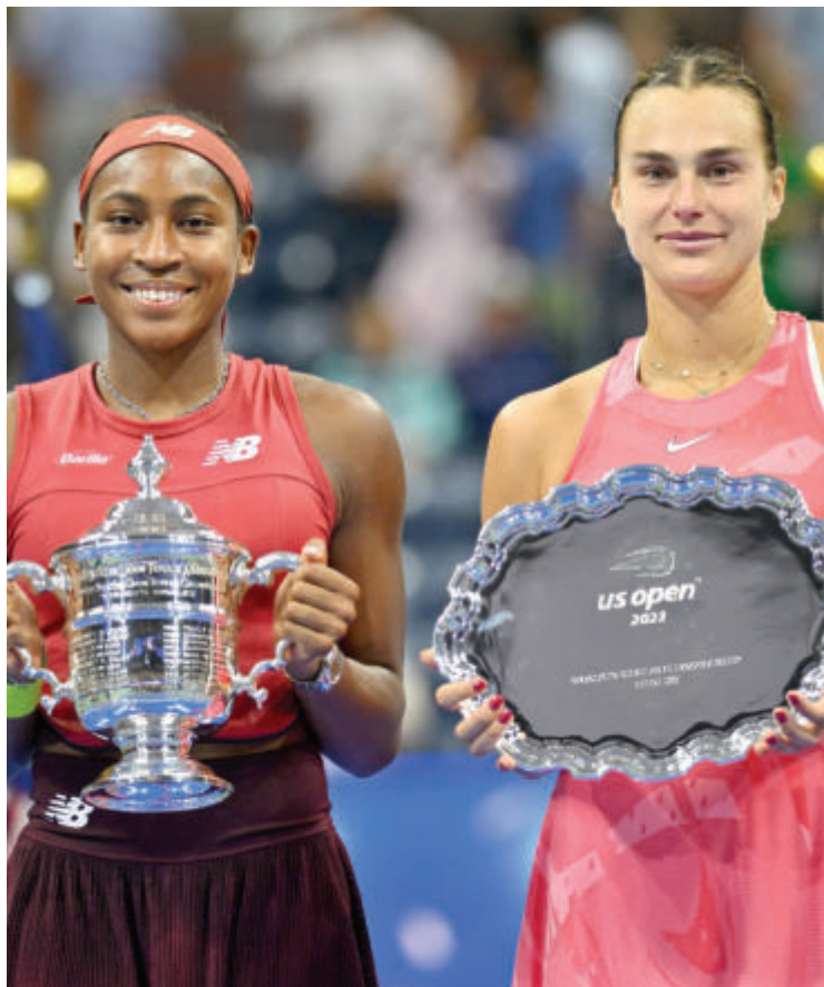
Шампионката Коко Гоф и финалистката Арина Сабаленка позира с трофеите от US Open

При мъжете за титлата през нощта спориша Новак Джокович (Сърб, №2) и Даниил Медведев (Рус, №3).