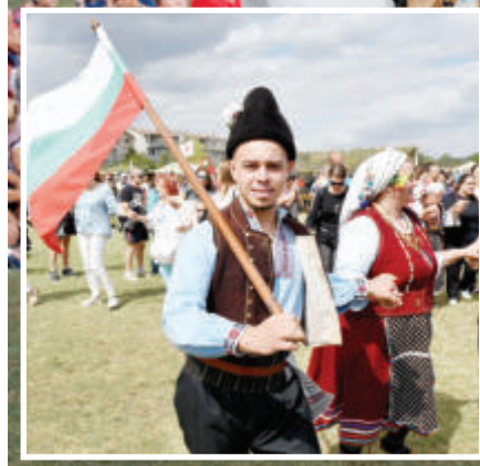
„Сдружение за възстановяване на българската слава "БРАН" организира 11-я културно-исторически спектакъл под наслов "Българската армия - от Аспарух до наши дни" в село Тополи край Варна. Гости на събитието бяха Представителния духов оркестър на Военноморските сили, деца от гайдарска формация "Тракия", Детско-юношеска школа "Алегра" и други