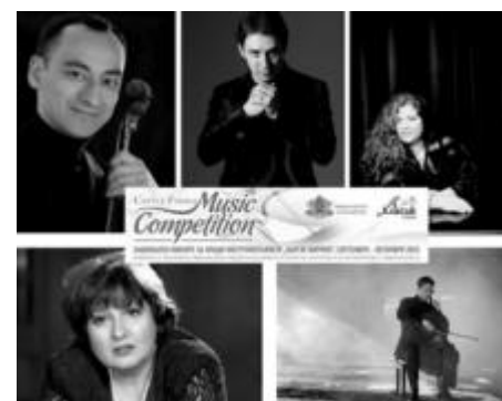
КОЛАЖ „КАНТУС ФИРМУС“