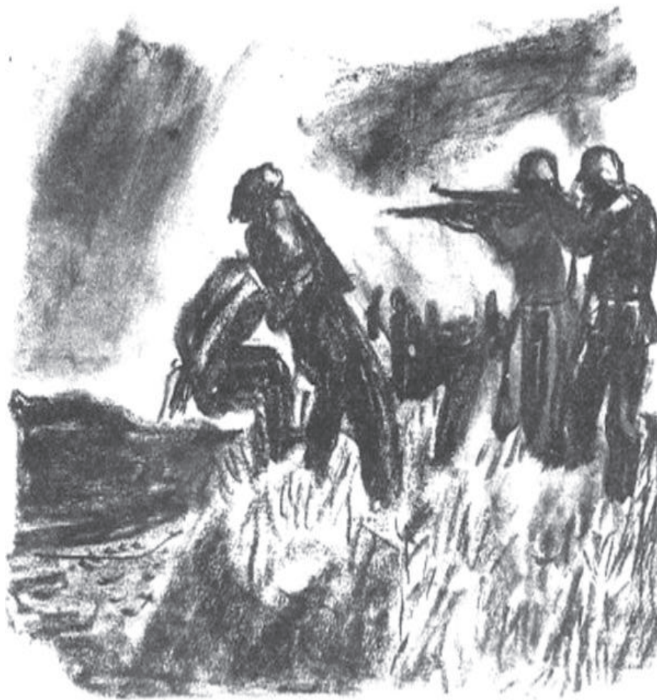
Худ. Борис Ангелушев. Илюстрация към поемата “Септември”, изд. 1948 г.

О, мои бедни, угнетени братя, кажете ми къде е изхода от злото и как да се спасиме от теглата? Кажете начин да строим хомота, за да настане радост на земята? - Борбата.