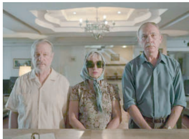
„Нека танцът да започне“ - реж. Марина Сересески

С перфектен кастинг, целият чаровен ансамбъл, вдъхновен от солидна драматургия, запленява с богатството от изразни средства на една прекрасна, наистина забавна и развлекателна комедия с точни послания, в традицията на най-качественото кино в този жанр. Едва ли някой би могъл да забрави уникалните като топлина