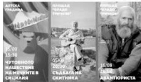
СНИМКИ "СОФИЯ ФИЛМ ФЕСТ"