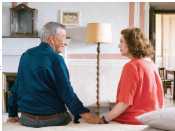
„Никога не е късно за любов“ - реж. Джани ди Грегорио

Въвеждайки ни в едно колкото любопитно, толкова и напрегнато пътуване с автобус от Дания до Париж, в течение на една седмица, изгълнено с неочаквани перипетии и сблъсъци, сценарият умело разгръща историята на двете обичащи се сестри Ингер и Елбн. Така постепенно потъваме в триъгълника на силата на истинската любов и отговорността към нея; за нашата позиция спрямо различия: търпимост или конфронтация, жалост или дискриминация. А майсторското многопластово, силно драматично изпълнение на Софи Гробьол в главната роля на болната Ингер (споделяща със сънародниците си битката за своето здраве), която в хода на действието се променя