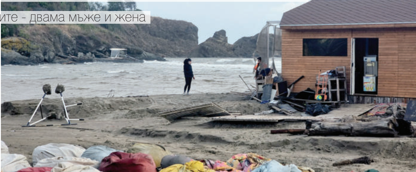
Обилните дъждове нанесоха щети върху плажове и сгради по Черноморието

Отводняваше се в село Лозенец и къмпинг "Оазис". Допълнителни екипи с хидрофорни помпи изпомпваха контролирано вода от два язовира в Лозенец, за