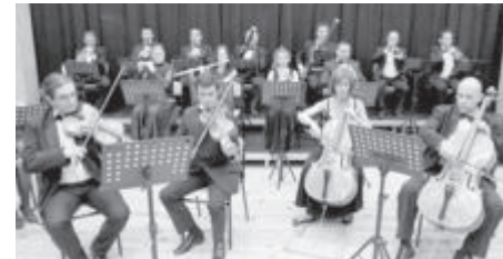
СНИМКА ОКИ „НАДЕЖДА”

Симфониета „София” ще свири в зала „България”