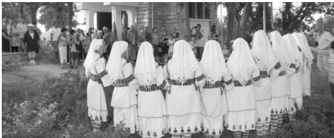
Женски хор от село Свирачи пее пред параклиса на връх Свети Илия

„Мистерииите на Хухла“ се провеждат с активната подкрепа на Община Ивайловград и под патронажа на Министърството на културата. Тази година културният фестивал навършва 25 години.