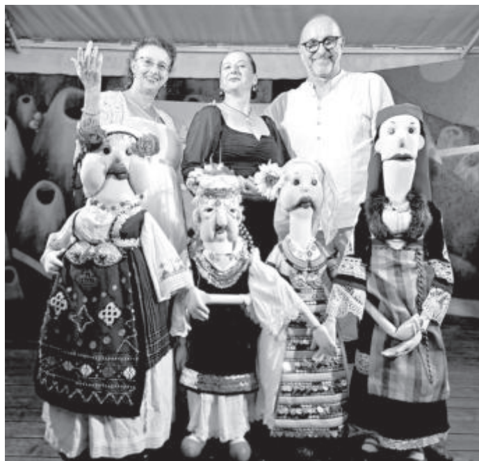
СНИМКА КУКЛЕН ТЕАТЪР „ВЕСЕЛ”

Спектакълът „Рибарят и златната рибка” е програмиран в афиша на „Нощ на Самоводската чаршия”, а в края на септември „Русалка” пътува за Босна и Херцеговина за участие в третия фестивал на кукленото изкуство „Флум 2023” в старинния град Мостар. „Забранено за възрастни” в Смолян е фестивалът, където търновските театрални ще представят „Есенна въртележка”. По-късно през октомври „Русалка” пътува