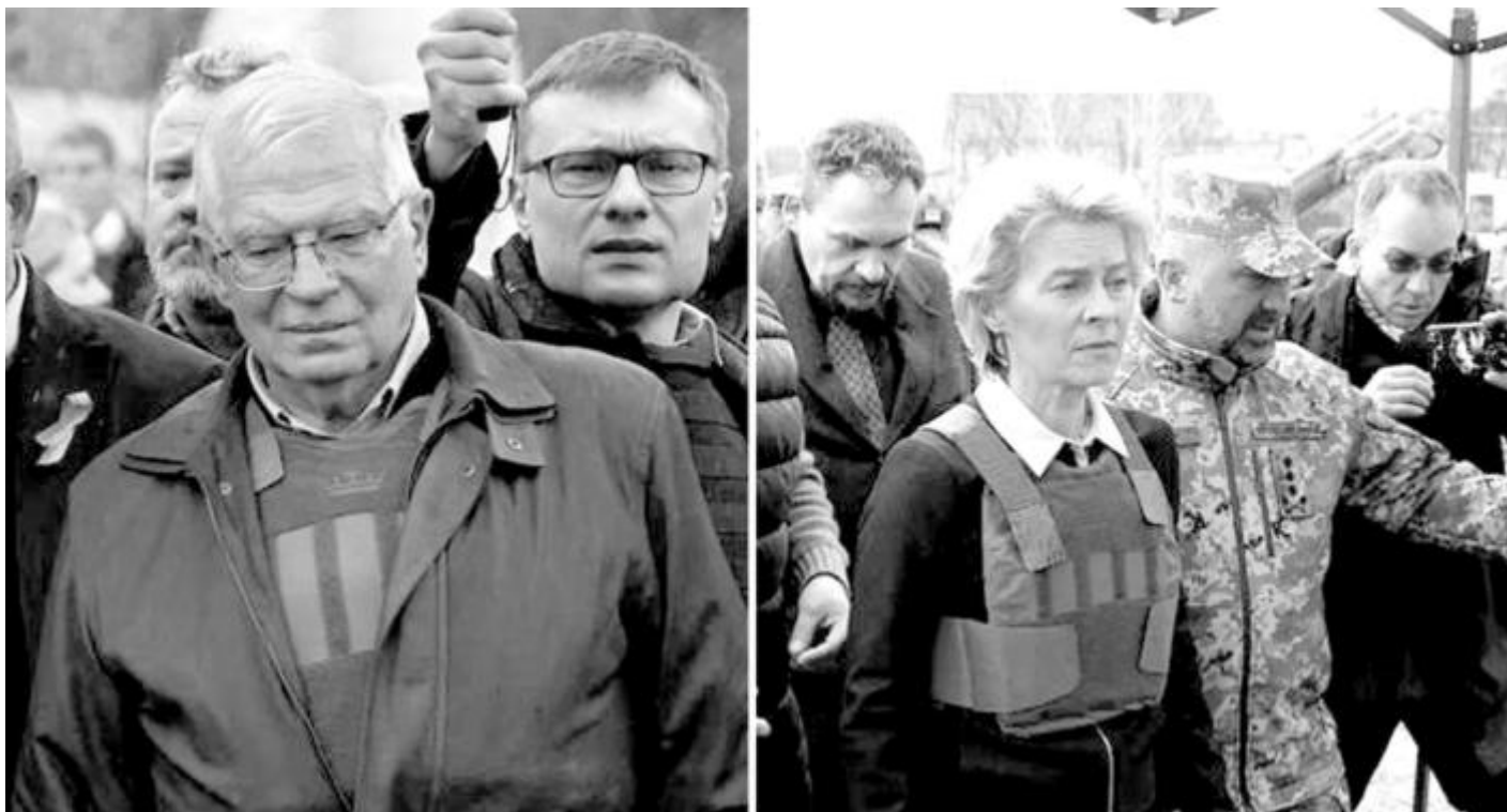
Жозеп Борел и Урсула фон дер Лайен хвърлят милиарди за режима в Киев, докато управляваната от тях Европа затъва все повече

Русия бележи успехи не само на международната сцена - развива се нейната индустрия, наука, култура, спорт... Ще приведа само един пример от последните месеци, който свидетелства за качеството на руското образование и наука - за разлика от това на Запад и у нас, които тотално деградират. На 27 юни с ракета-носител “Союз-2.1б” в Космоса бяха изведени три нискоорбитални спътници за комуникация по проекта “Рассвет”. Те осигуриха първия руски интернет от Космоса.