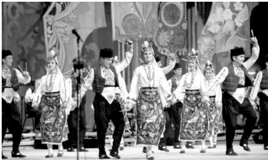
Националният фолклорен ансамбъл „Филип Кутев“ ще изнесе празничен концерт в Деня на независимостта

Под този наслов от стих на Ивайло Балабанов ще преминат „Мистерииите на Хухла“ на 22, 23 и 24 септември