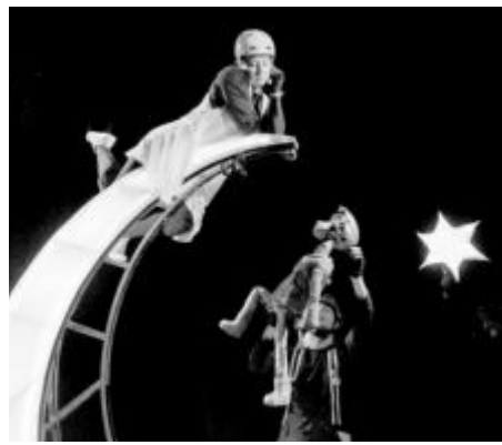
СНИМКА ДКТ СТАРА ЗАГОРА