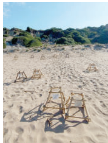
Тук гнездят костенурките