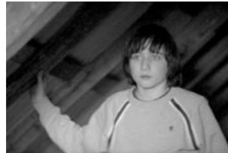
СНИМКА МФФ "ЛЮБОВТА Е ЛУДОСТ"

Филм с голямата награда в Кан закрива фестивала „Любовта е лудост“