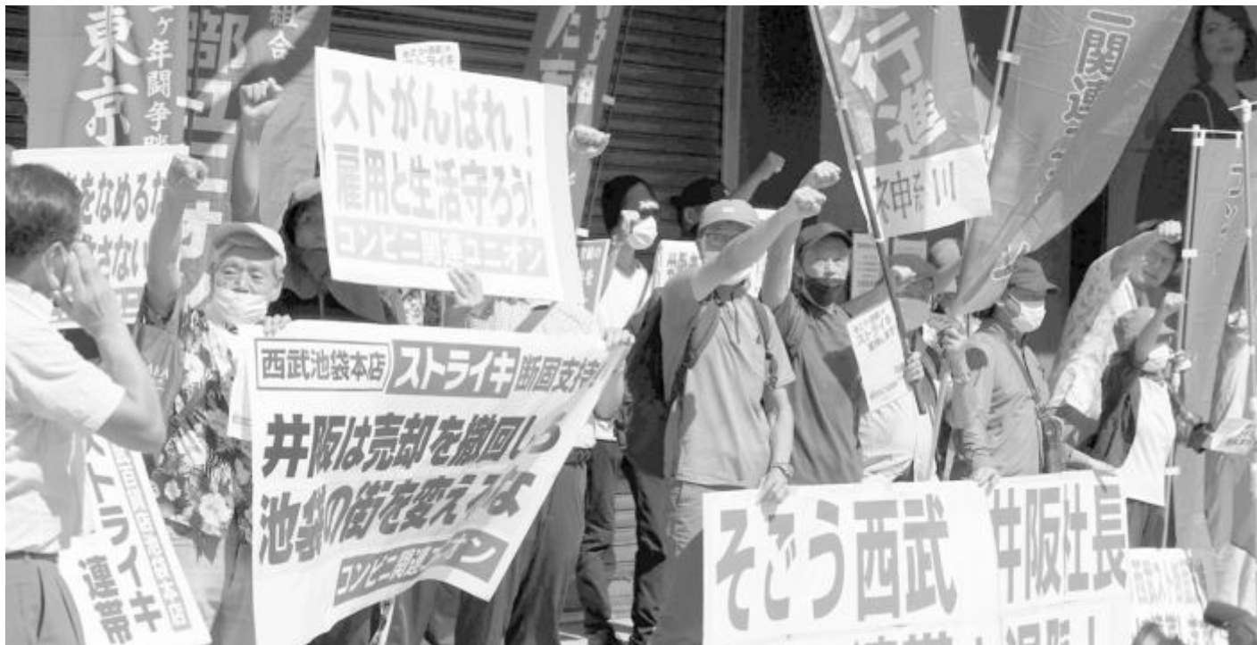
Профсъюзът на работниците в супермаркетите в Япония излезе на многохиляден протест за искане за по достойни условия на труд. Хората са недоволни и от плановете една от най-големите вериги да бъде продадена на компания от САЩ, което може да доведе до масови съкращения