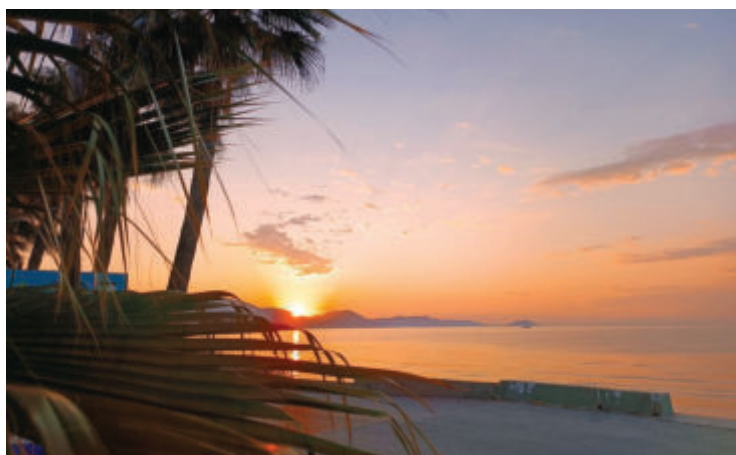
Изгрев над Закинтос