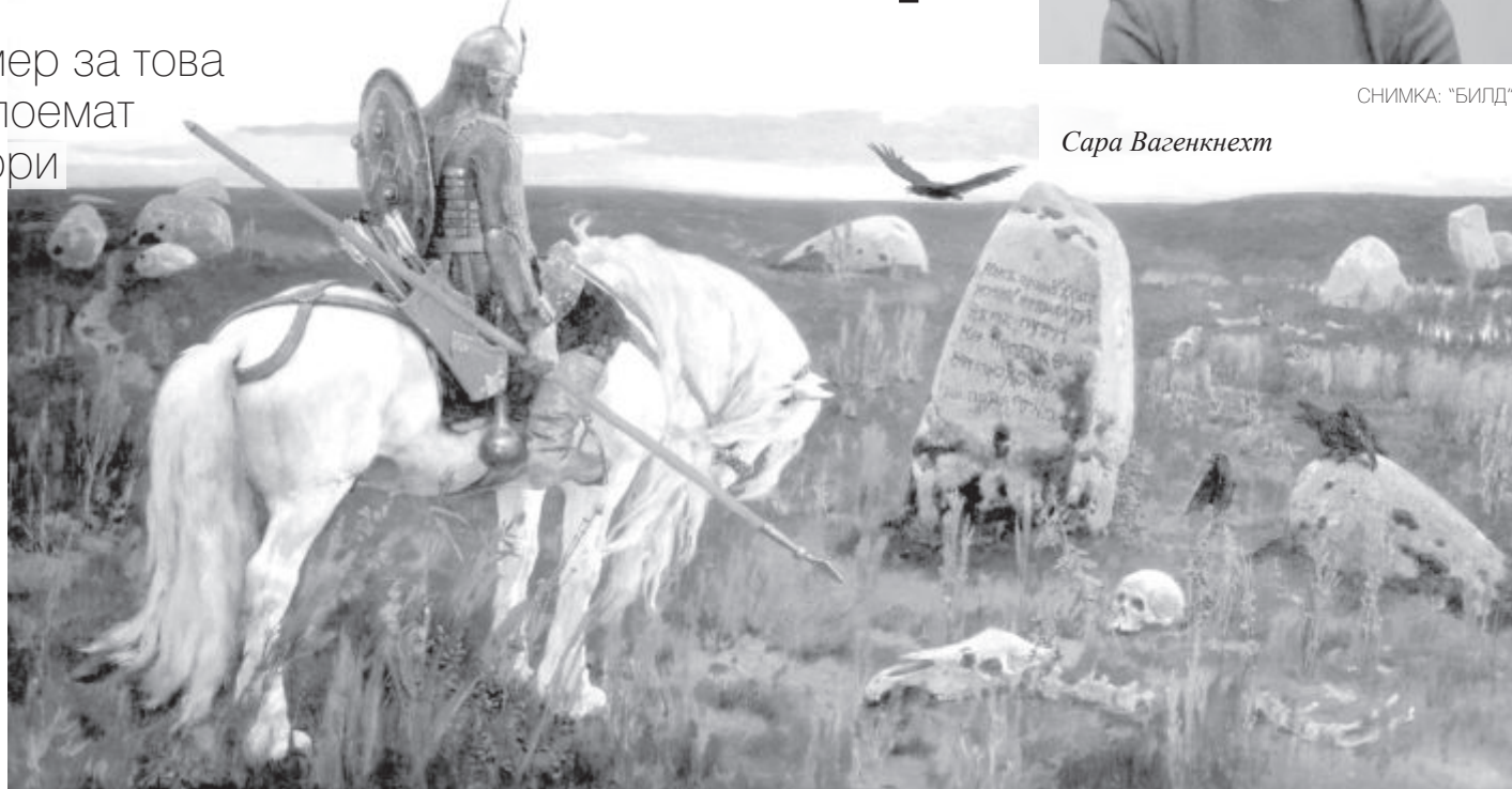
КАРТИНА: ВИКТОР ВАСНЕЦОВ "РИЦАР НА КРЪСТОПЪТ" (1878 Г.)

Парадоксално, но на същата позиция по отношение на начините за решаване на кризата и изпращането на оръжие като Вагенкнехт е популистката "Алтернатива за Германия". Още по-парадоксално е, че сред привържениците на въпросната партия Вагенкнехт е също толкова попу-