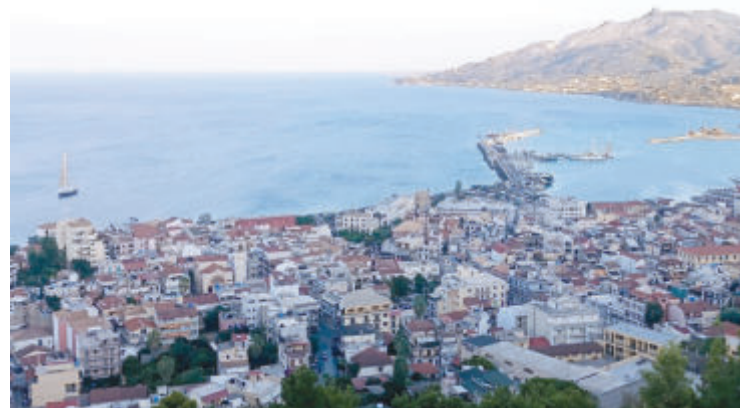
Изглед към града Закинтос