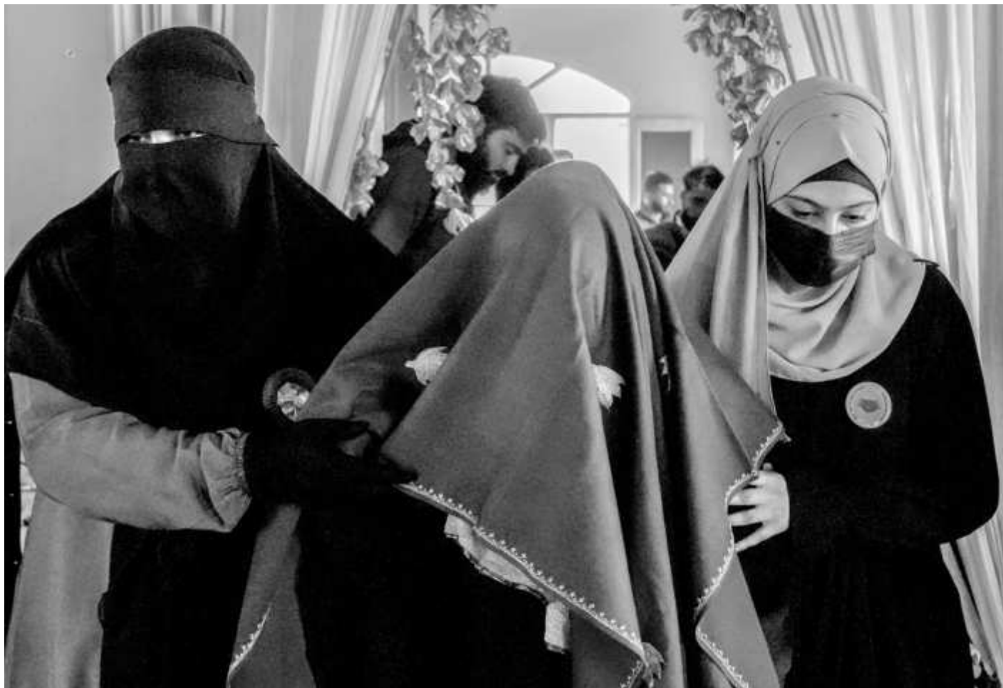
Мюсюлмански булки в Кашимир се подготвят за масова сватба. Социални организации подкрепят и дори организират подобни събития, за да бъдат подпомогнати социално слаби семейства