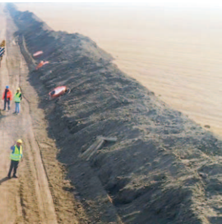
Злата от който се оказва доста съмнителна

гарският парламент прие закон с неясна предистория и все още доста трудно за разбиране съдържание, според който цената за транзита на природен газ от Русия през България трябва да бъде рязко увеличена" По думите му унгарското правителство се е свързало с партньорите си от България и Сърбия по този въпрос, за да се предотврати ситуация, при която получаването на руски петрол да стане невъзможно.