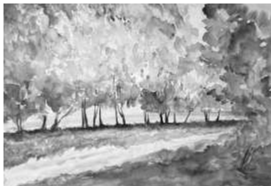
Светла Чакърва, „Край реката“