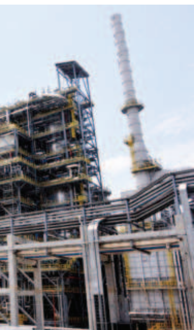
ията ползва годишно финерията ще плати на горивата

Междувременно на срещи с български политици посланикът на Сърбия в София Желко Йович е подчертал безпокойството си, че допълнителната финансова тежест върху цената на газа ще повлияе върху социално-икономическата среда от