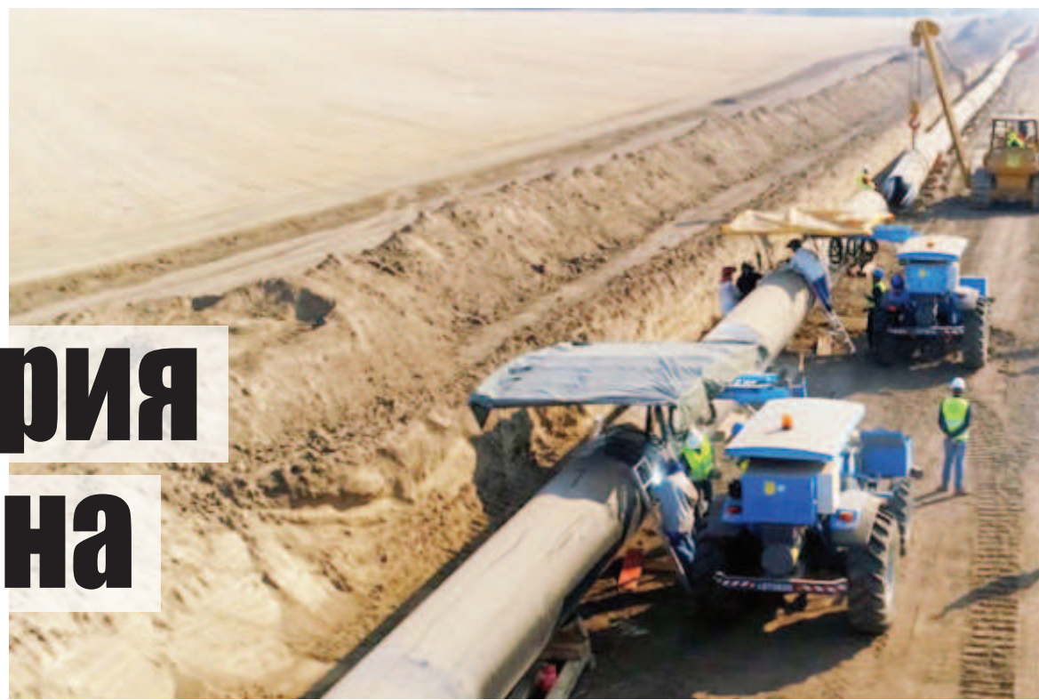
Правителствата на ГЕРБ похарчиха 3 млрд. лв. за изграждането на газопровода „Турски поток”, по

След взривяването на газопроводите „Северен поток” в Балтийско море доставките минават през Украйна и България, но Киев отдавна заяви, че няма да поднови договора за пренос към Централна Европа, изтичащ в края на 2024 г. По оценки на „Блумбърг” около половината от природния газ, все още влизащ по тръби в ЕС, преминава по „Турски поток” и България. Сиярто каза още във видеообръщение на страницата си във „Фейсбук”: „Бъл-