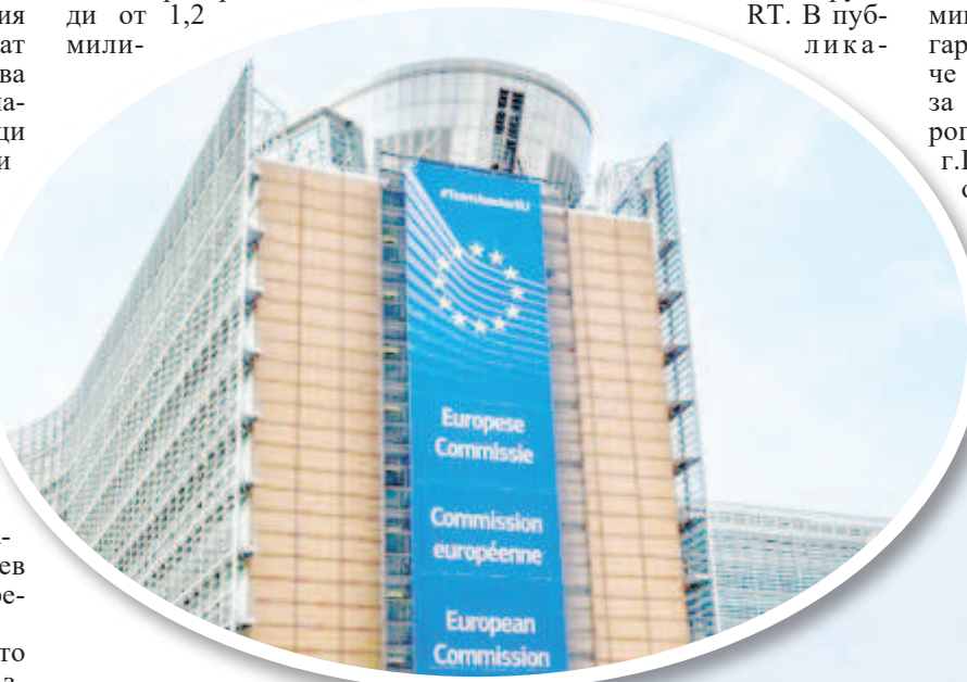
По всяка вероятност газовият спор на Балканите ще се реши с намесата на Брюксел

С промените в закона отделно ще има наложен акциз и на рафинерията „Лукойл Нефтохим Бургас”, която работи с руски природен газ и произвежда около 400 млн. куб. м. или 4 млн. мегаватчаса. Това означава, че разходите ще бъдат около 80 млн. лв. допълнително. Това ще се отрази в крайната цена на