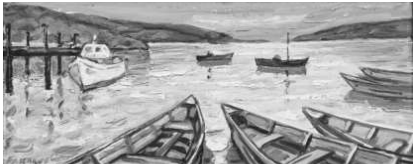
Бранимир Цаков, „Привечер“

Избрани пленерни творби от фонда на арт салона в Оряхово са подредени в столичното пространство на „Контраст“