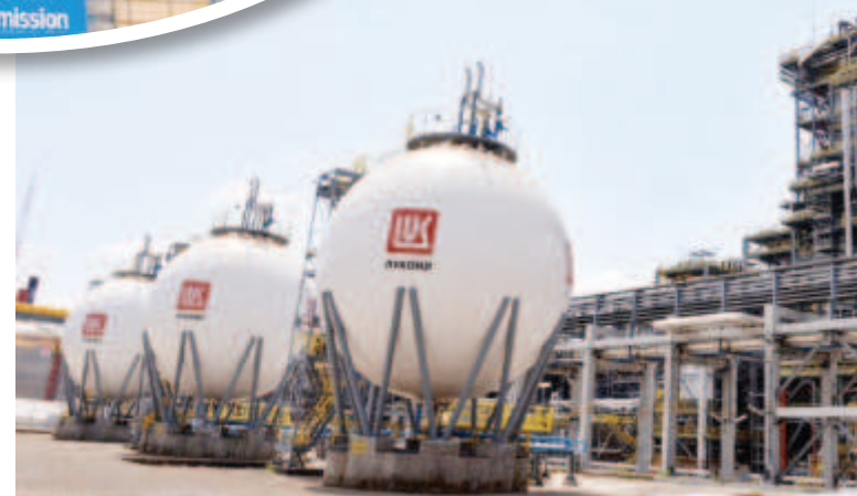
С промените в закона отделно ще има наложен акциз и на рафинерията „Лукойл Нефтохим Бургас”, която работи с руски природен газ и произвежда около 400 млн. куб. м. или 4 млн. мегаватчаса. Това означава, че разходите ще бъдат около 80 млн. лв. допълнително. Това ще се отрази в крайната цена на