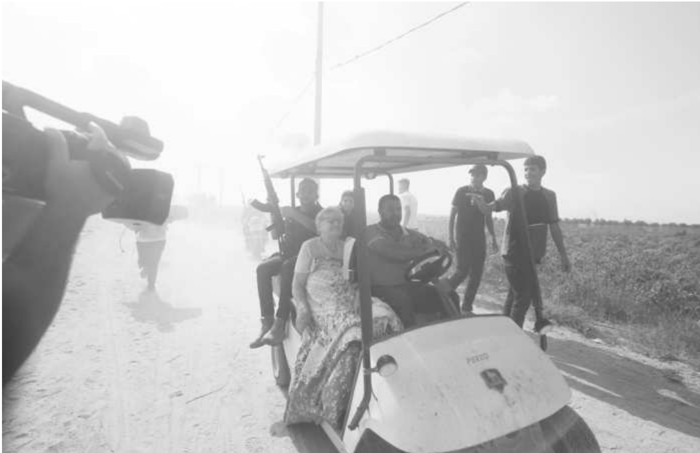
Хамас държи между 200 и 250 израелски заложници в Газа, съобщи говорител на групировката. Те ще бъдат използвани като разменна монета за освобождаването на 6000 палестинци, които се намират в израелски затвори