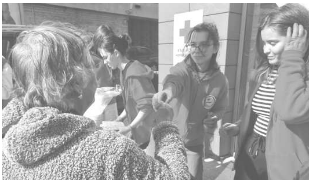
Доброволци към Българския младежки червен кръст във Велико Търново раздадоха над 120 порции храна на нуждаещи се хора в центъра на града