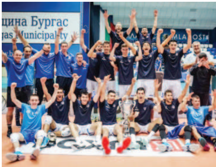
Волейболистите на Левски се радват със Суперкупата на България по волейбол