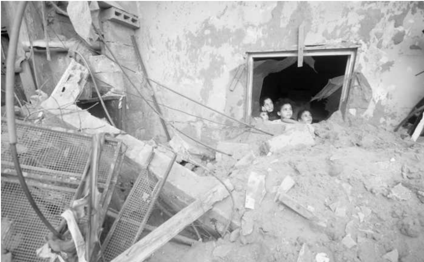
Изrael, Египет и САЩ са договорили примирие в южната част на Газа за доставка на помощи, предадоха световните агенции, позовавайки се на представители на египетските власти. Според дипломати в региона ситуацията там остава непредсказуема. Тел Авив и Хамас засега отричат да има примирие в южната част на Газа