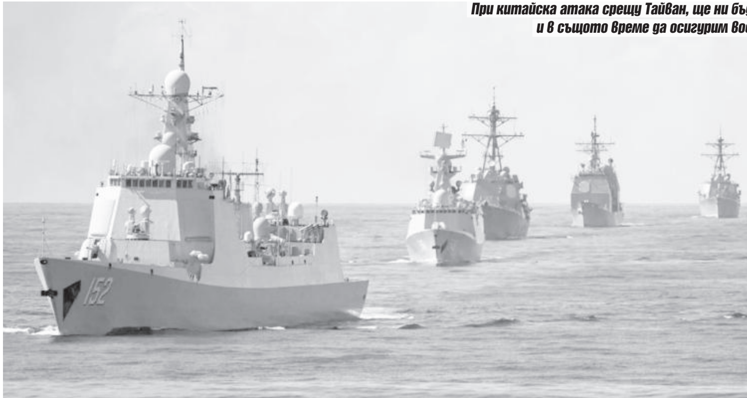
Китайска морска армада в Тихия океан

При китайска атака срещу Тайван, ще ни бъде трудно да отблъснем атака и в същото време да осигурим военна помощ за Украйна и Израел