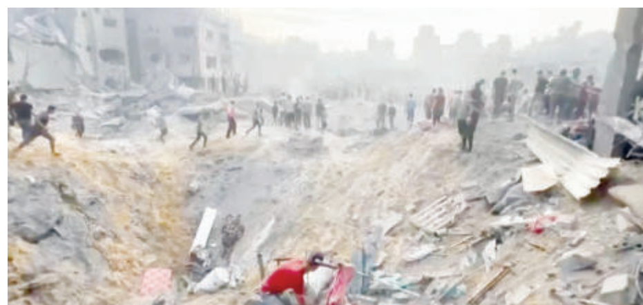
Най-големият палестински бежански лагер Джабалия след бомбардировките

Журналисти на Би Би Си обвиниха британската държавна телевизия в пристрастно отразяване на израелско-палестинския конфликт и военните действия в Газа. Осем журналисти от Великобритания, работещи за Би Би Си, обвиниха работодателя си, че не отразява точно историята поради „липса на критична ангажираност с твърденията на Израел“ за конфликта, се казва в писмо на журналистите, цитирано от „Ал Джазира“.