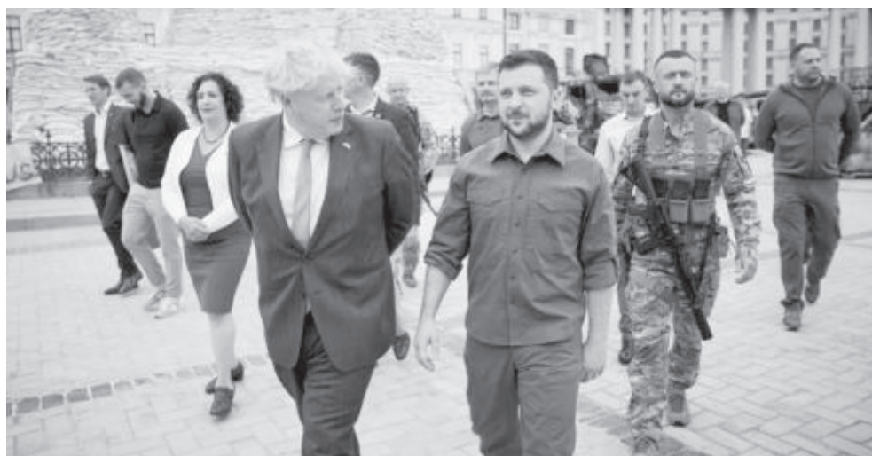
2022 г. Борис Джонсън със Зеленски в Киев

Войната в Украйна можеше да приключи още през пролетта на 2022 г., ако Украйна се беше съгласила на неутралитет, каза Давид Арахамия, ръководител на парламентарната група на партията на Володимир Зеленски „Слуга на народа“.