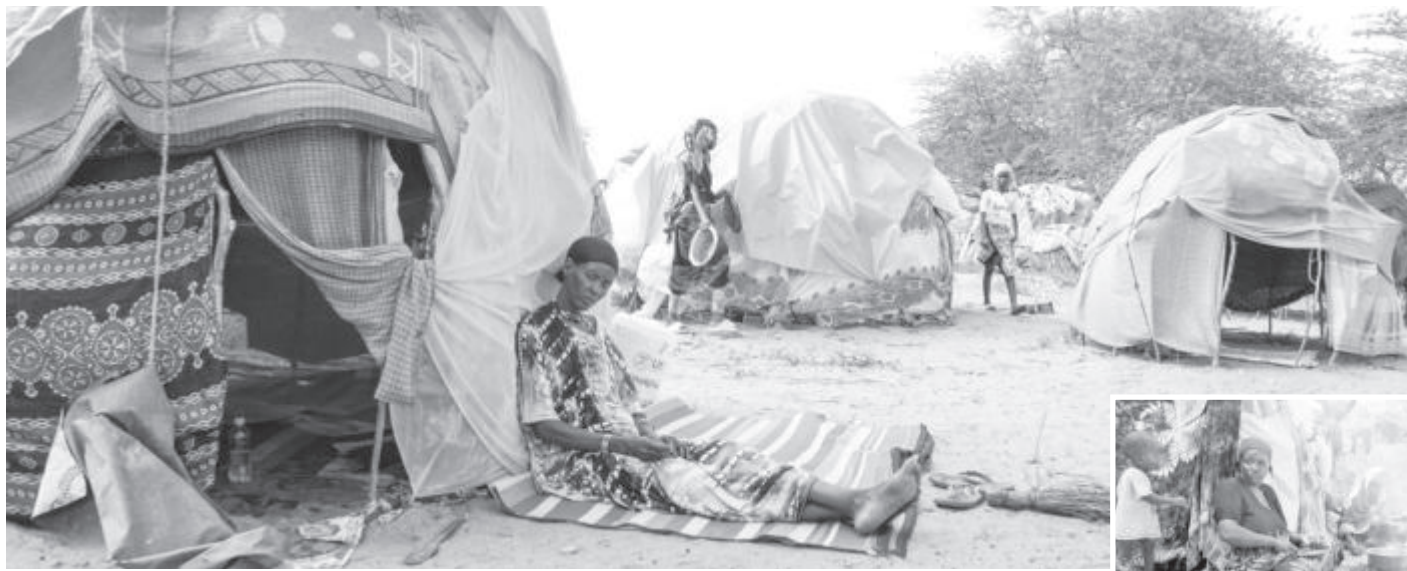
След наводненията причинени от явлението Ел Ниньо много хора в Кения останаха без покрив над главите си. Най-малко 71 човека са загинали, а хиляди са разселени и принудени да живеят в палатки