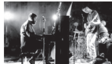
СНИМКА EYOT@WRONG FEST ПАНЧЕВО (2019)