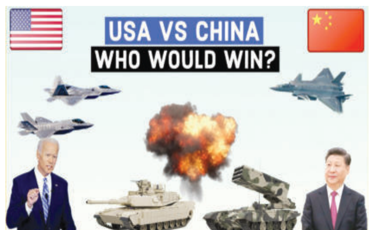
САЩ срещу Китай. Кой би спечелил?