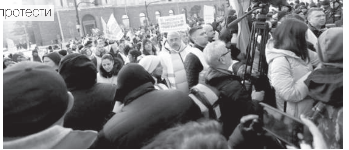
Фермерите вече няколко пъти протестираха с искане за по-големи субсидии

От земеделското министерство са категорични, че са заявили към Министерството на финансите необходимостта от осигуряване на 426 млн. лв., но това искане не е удовлетворено. Председателят на земеделската комисия в парламента Десислава Танева също обяснила, че нищо не може да направи, затова земеделците трябва да се обърнат към