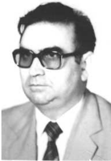
ПК "Единство", Новогагорско землячество, колеги, другари и приятели