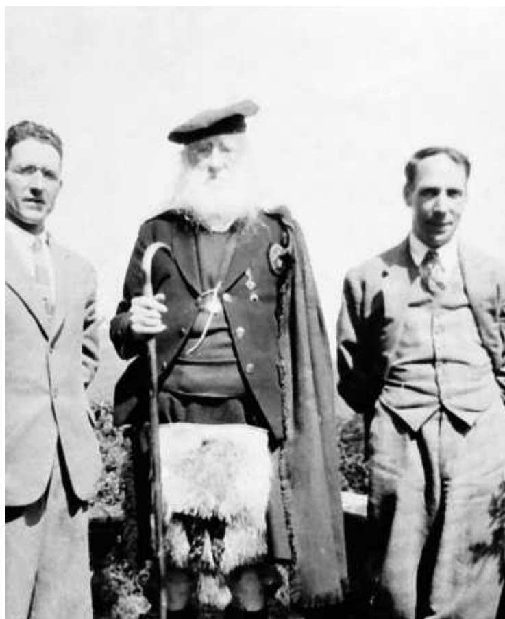
Татко Махони и побацими