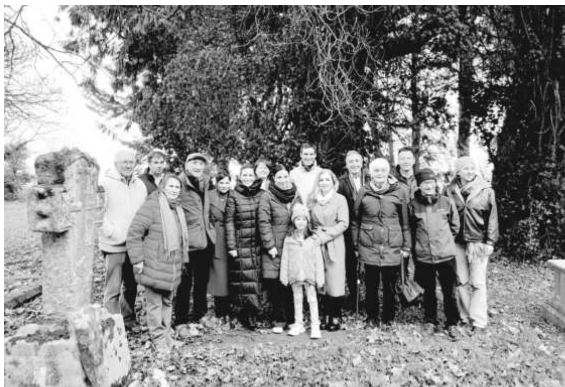
Снимка за спомен с родственици на ирландския благодетел Пиърс О'Махони и неговите чуваници

Към паметника му в Дъблин през 2010 г. е прибавена мраморна плоча с благодарствен надпис от българския народ. Инициативата е на българския посланик тогава НП Емил Ялнъзов.