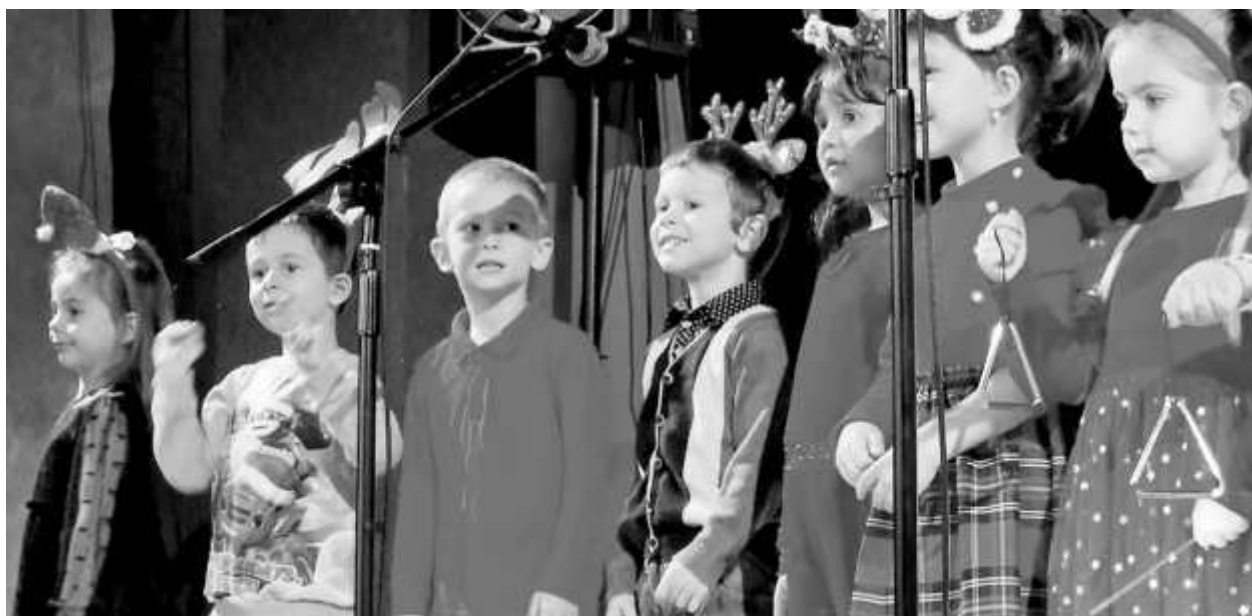
Възпитаниците на школите при Центъра за подкрепа на личностното развитие в Пещера излязоха на сцената на читалище "Развитие" на голям Коледен концерт-спектакъл. Пред препълнената зала с родители, приятели, жители и гости на града децата представиха тематични коледни народни песни