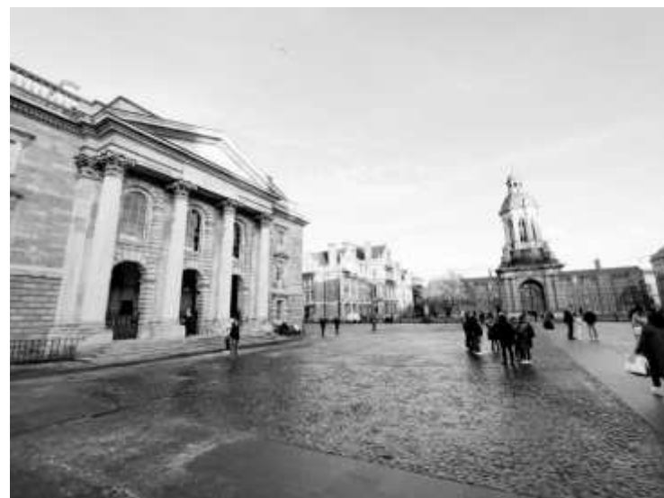
Тринити колидж, където е учил героят от "Роден на Великден"