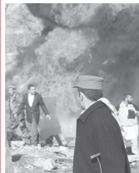
Най-малко 13 души бяха убити, а 40 ранени при самоубийствен атентат в центъра на афганистанската столица Кабул. Нападението беше извършено от атентатор-намикадзе с кола-бомба пред хотел, посещаван от чужденци, в централен дипломатически квартал на Кабул

Най-малко 16 души бяха убити при атентат с кола бомба в пакистанския град Дера Гази Хан в провинция Пенджаб. Трийсетина са ранените при нападението, извършено на оживен пазар в града, разположен на 500 км югозападно от Исламабад, уточнил началникът на местната полиция. Взривът оставил огромна яма и разрушил няколко магазина и къщи, сред които на местен политик.