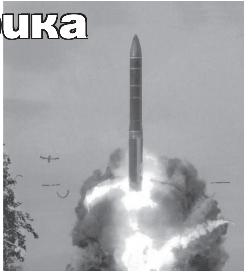
Във Воткинския завод правят стратегическите ракети „Булава”

А какво означава обект на непрекъснато наблюдение? Както обясниха на журналистите в Националния център за намаляване на ядрената опасност, цялата продукция, излизаща от Воткинския завод, де-