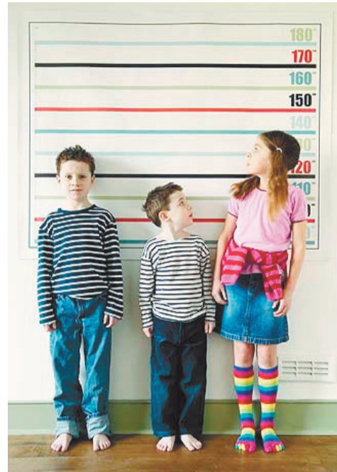
нейджърките се гордеят с ръст 177-178 см, който може да ги вкара в мечтаната от тях листа на манекенките. Но и при

Преобладаващата част от българите са средни на ръст - около 175 см за мъжете и 165 см за жените. Т.е. българите значително са пораснали от времето на Великото преселение на народите, когато според историческите справки са описвани като хора със среден ръст около 160 см. Съвременният типаж за България е не много як, висок 180-190 см с изразен мускулен релеф. При съвременните българки за разлика от често срещания нисичък закръглен тип предимно на средна възраст, младите момичета са по-често издължени, по-високи и по-фини от майките си. Ти-