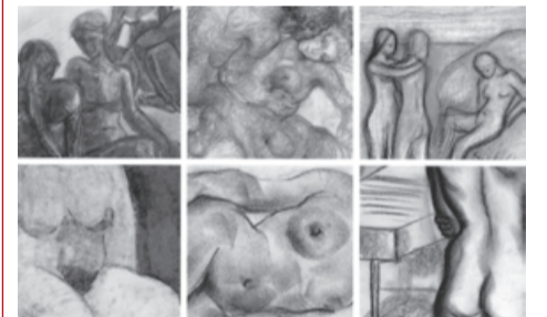
Рисушки на жени художнички от началото на XX век до 90-те години под наслов „Следите на стила: между модела и тялото“ е подгредена от днес в галерия „Васка Емануилова на бул. „Янко Сакъзов“ 15

Един от най-интересните паметници на средновековната българска култура - слънчев каменен часовник, ще бъде показан на 17 декември в зала 3 на НИМ след едногодишна реставрация и консервация. Експонатът е открит през 2008 г. в една от крепостите на Провадийското плато, служеща за пряка защита на гребната столица Плиска. Паметникът представлява композиция от връзан полукръг върху каменен блок, разделен на десет равни части плюс две по-малки, бележещи неговото начало и неговия край. В центъра на часовника допълнително е връзан кръст. Най-вероятно той е бил врагден на видно място в крепостта така, че максимално точно да отразява движението на слънцето. Слънчевият часовник от фонда на НИМ е единствен по рода си от ранното Средновековие, открит по българските земи, а може би единствен и на територията на Югоизточна Европа, уточняват от НИМ.