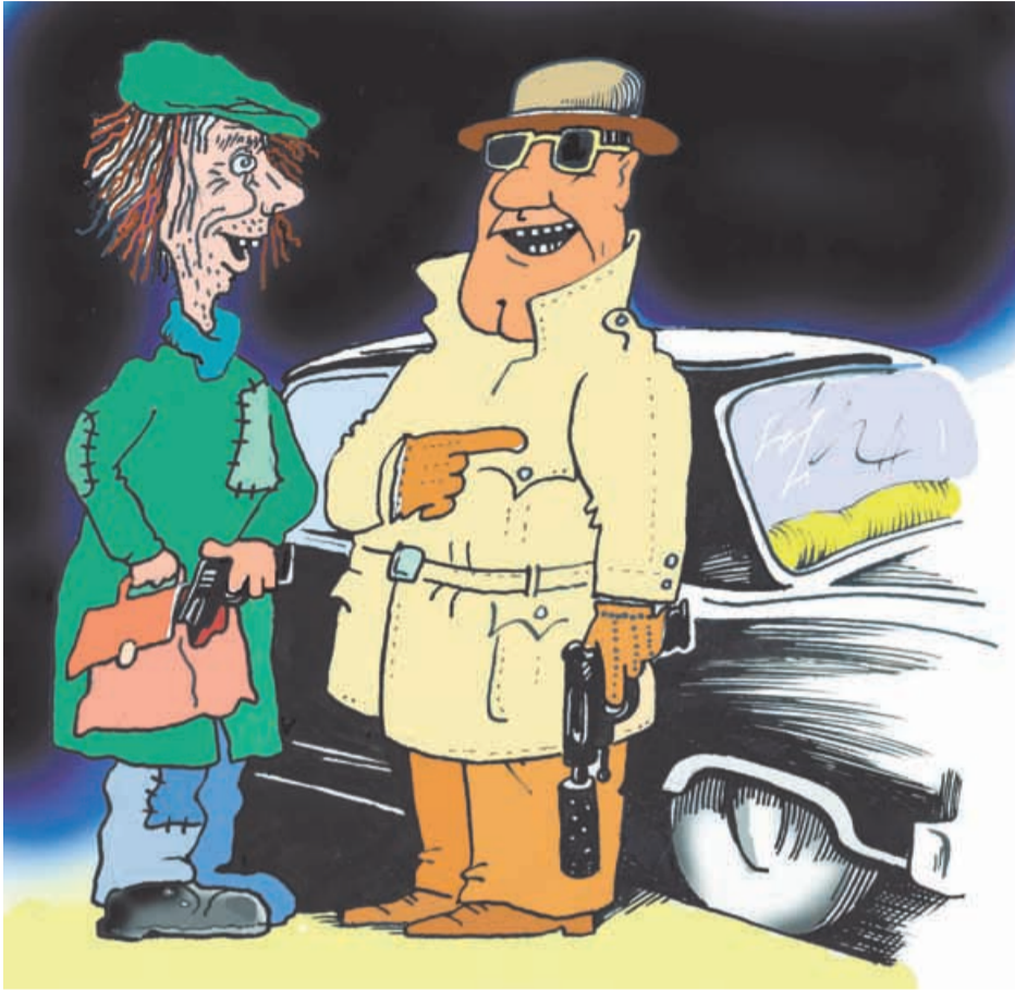
- Два офиса и един супер... за днес „напазарувахме“!