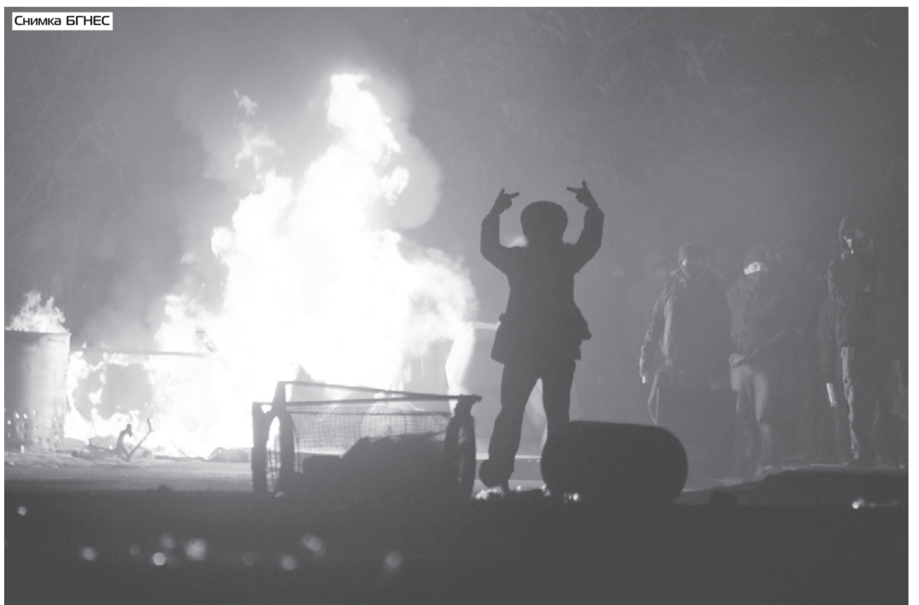
Анархисти атакуваха полицията с коктейли „Молотов”