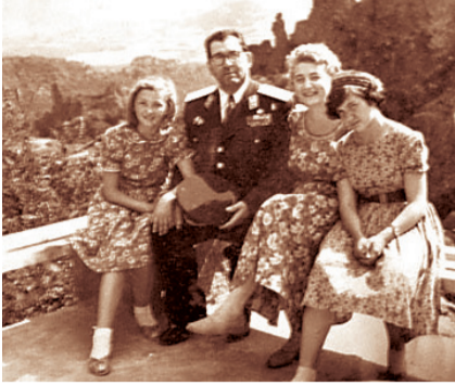
Генерал-полковник Иван Кинов със семейството си