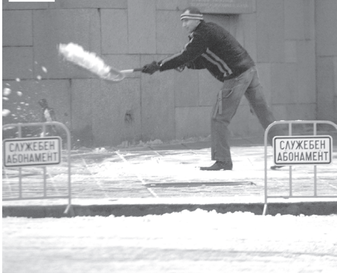
Мъж почиства снега от тротоар в центъра на столицата. Кметът Йорданка Фандъкова напомни вчера, че общината има ангажимент да чисти само улици и спирки, а за другото отговарят гражданите