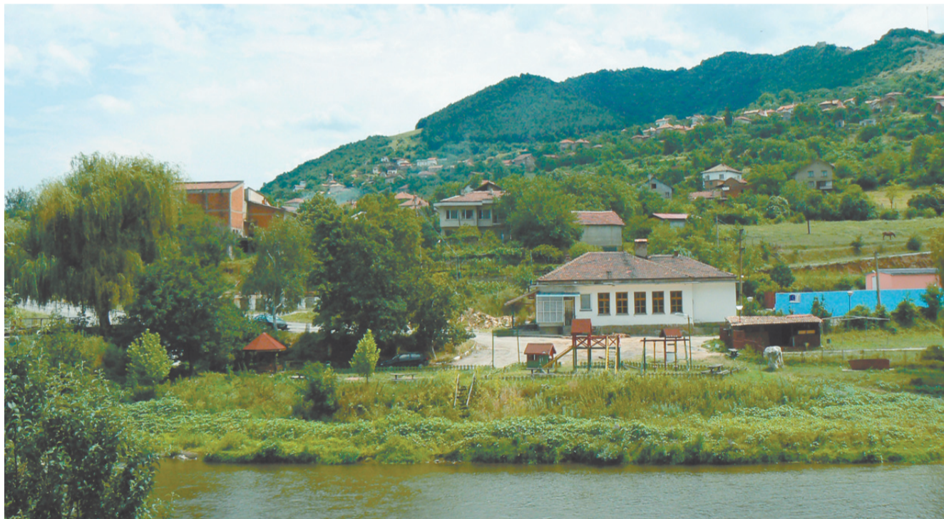
Люти брод, където беше паметникът на българския държавник

Бюст-паметникът обаче е отнесен. В писмото не се казва от какво е бил направен. Ако е отлят от метал, трябва да попитаме полицията дали са проверени веднага околните пунктове за изкупуване на скрап. Ако не е извършена такава проверка, значи че някой от органите на реда покровителства железарската мафия. Но да не гадаем, местните хора могат да проверят това. Друг е въпросът за акт на политическия реваншистки ванда-