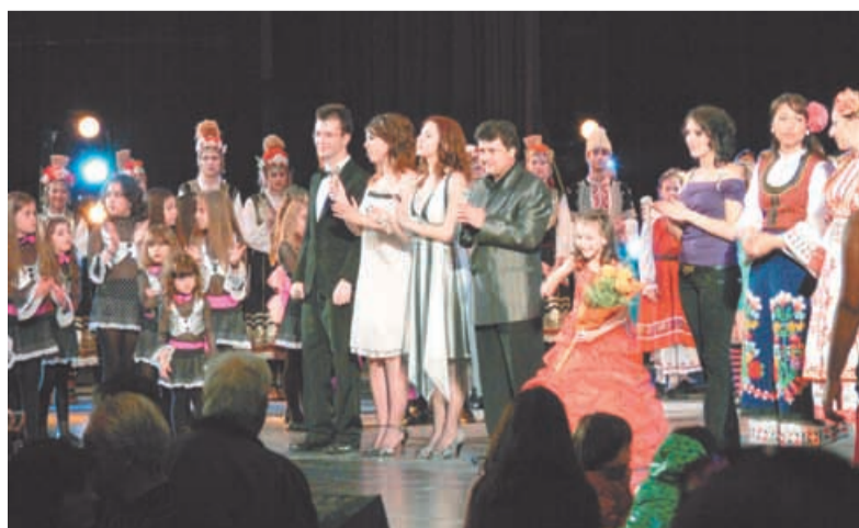
На тържествените си концерти младежите от читалището представят разнообразието от сценични изкуства