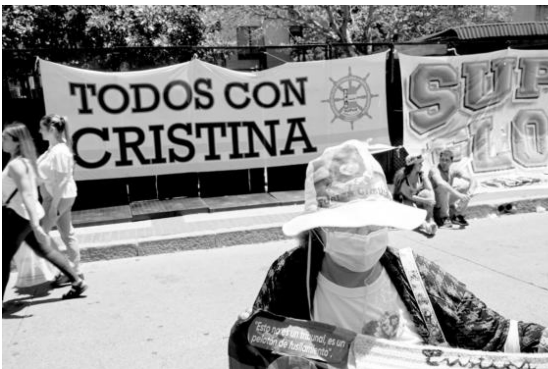
Въпреки скандалите за корупция все още има хора, които вярват на Кристина Кишнер и твърдят, че управлението ѝ е било успешно

Още не е встъпил в длъжност, това трябва да стане на 10 декември, а вредите започват. Аржентинци, които преди