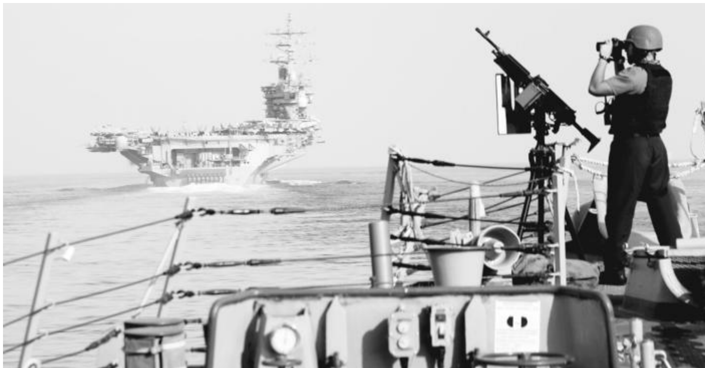
Броят на американските военни кораби в Персийския залив се увеличи. От САЩ твърдят, че искат да са близо, след като приключи примирието между Израел и Хамас. То беше удължено с още два дни, въпреки че Тел Авив продължава със стрелбата в Газа