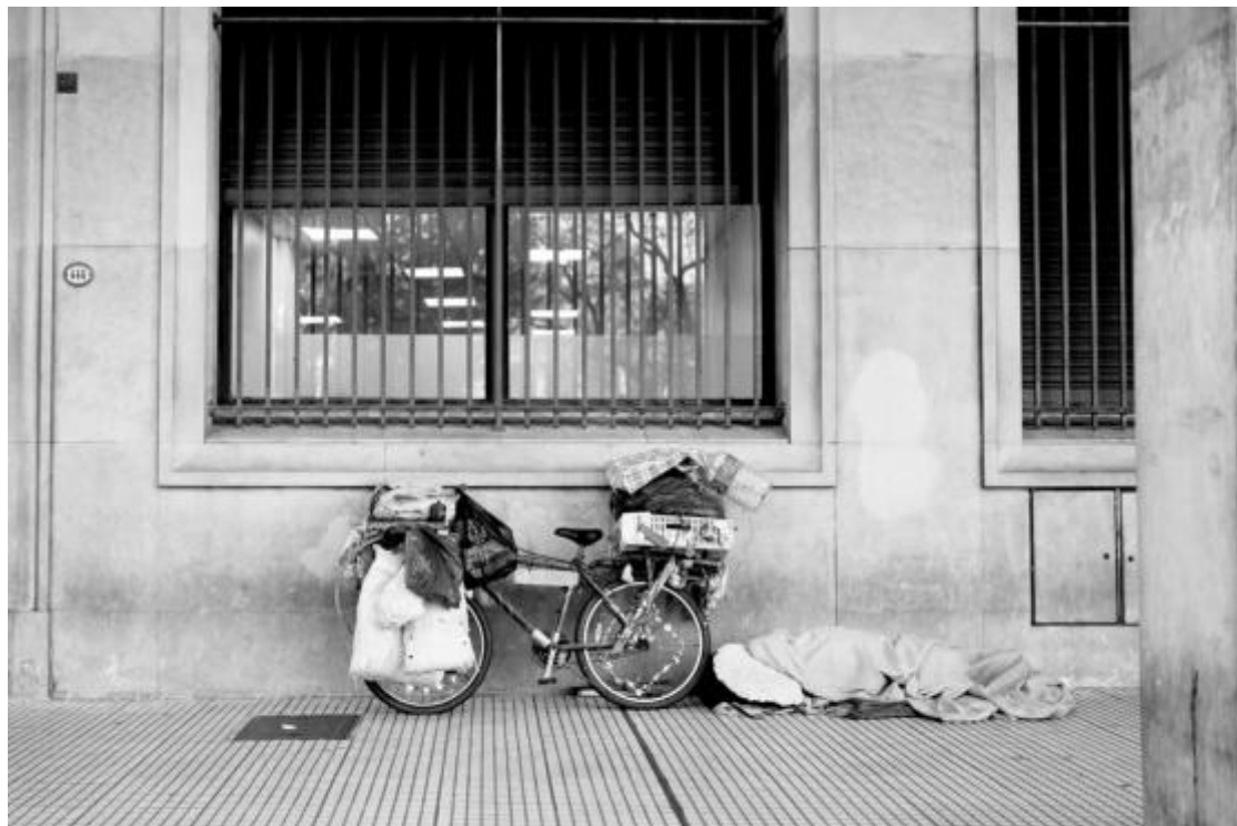
Все по-често срещана гледка по улиците на столицата Буенос Айрес са бездомници

Дали заради непрекъснатите клюки и интриги или пък, защото в крайна сметка самата тя стигна до подсъдимата скамейка и към всичко това се прибавят КОВИД пандемията и икономическата криза, но особено през последната година животът в Аржентина стана много труден. "Всеки ден отивам в магазина и виждам нови цени", коментира жител на Буенос Айрес и допълва: "Изляза ли от столицата, не е сигурно, че ще има къде да заредя колата си, липсата на горива се усеща навсякъде.