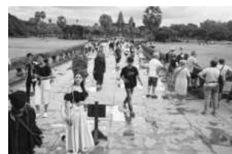
Най-големият религиозен храм - Ангкор Ват в Камбоджа, бе обявен за осмото чудо на света. В надпреварата той изпревари Помпей в Италия

При блъсканица по време на музикален фестивал в университет в Южна Индия са загинали най-малко 4 студенти, а други 60 са ранени. Започнало е разследване.