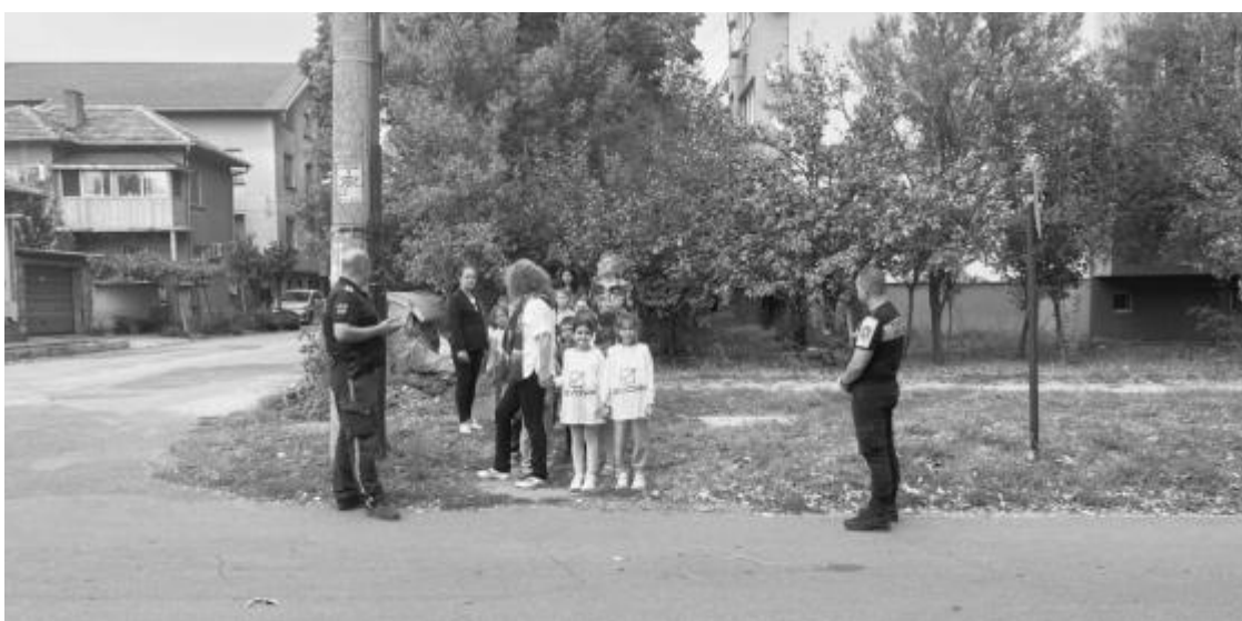
Учебен практикум по безопасност на движението се проведе за учениците от ОУ "Максим Горки" в град Левски със съдействието на Местната комисия за борба с противообществените прояви на малолетни и непълнолетни. Представители на РПУ-Левски отговаряха за безопасността на участниците при тяхното придвижване, а децата им задаваха въпроси и споделяха своя опит в движението като пешеходци

Припомняме, че още преди да приключи цялостната проверка, със заповед на началника на РУО-Пловдив беше освободен директорът на училището.