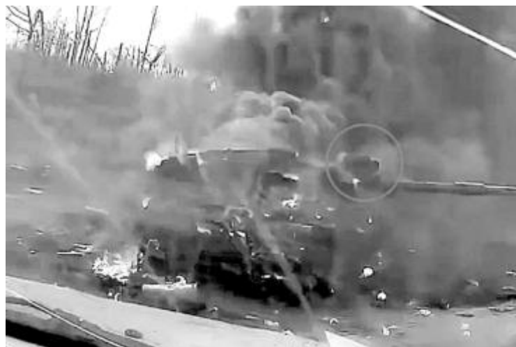
За пръв път в историята британски "Чалънджър 2" бе унищожен от руска противотанкова управляема ракета - в случая "Корнет"

ви, че ще даде на Киев 14 от своите танкове "Чалънджър 2" още в средата на януари, първата от западните страни. Заедно с тях Лондон предаде на украинската армия и бронебойни снаряди с ядра от обеднен уран.