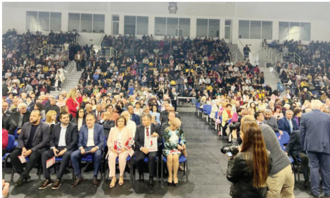
Препълнената зала на “Арена” - Шумен, събра стотици симпатизанти и членове на БСП

обществени поръчки на близки фирми, на кражба на обществен ресурс, промяна на този модел, в който хората се държат в зависимост през работни места, през страх, през социални кухни, през раздаване на дърва - със всички способности, уточни Нинова.