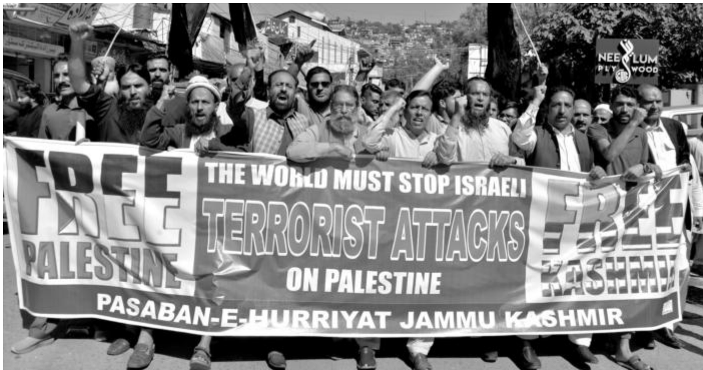
Пакистанци подкрепят атаката на ХАМАС. Мюсюлманите в различни държави се обединяват в подкрепа на палестинците. Войната вероятно ще навреди на сближаването на Израел със Саудитска Арабия, прогнозира анализатори