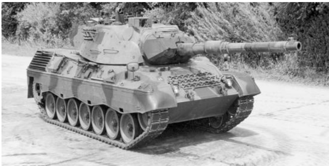
Десетки стари германски танкове Leopard 1 бяха изпратени в Украйна