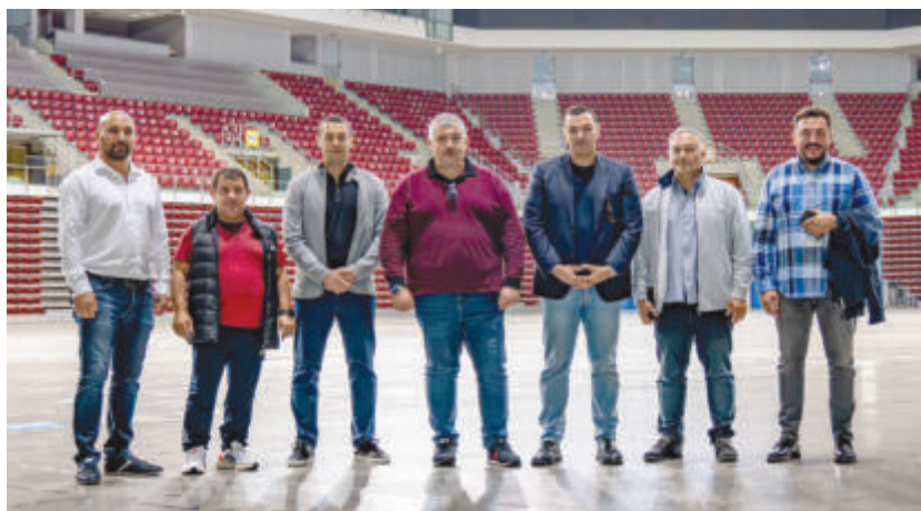
Представителите на Европейската федерация и на БФВТ на инспекцията на “Арена София”

За последно България организира подобен форум през 2005 г.