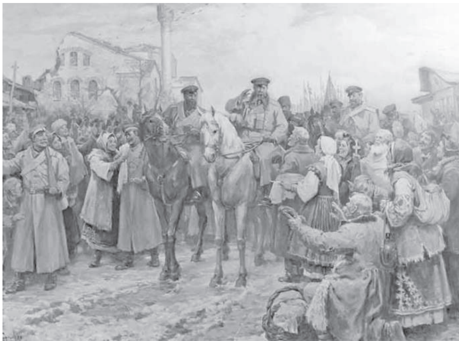
Посрещането на генерал Гурко в София, художник Димитър Гюдженев

Стихотворения от съвременни български поети