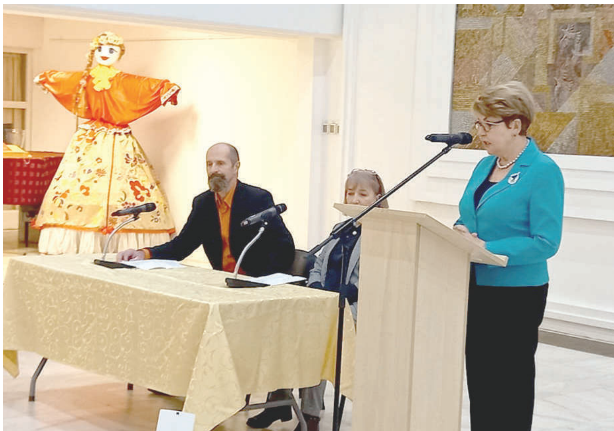
В навечерието на 3 март в Раднево, област Стара Загора, беше представена презентация на филма “Паметници на Руско-турската война в България”. На събитието присъства руският посланик у нас Елеонора Митрофанова, което бе организирано със съдействието на Стойна Ангелова, председател на организацията на БАС в Раднево

“България е една от най-старите цивилизации в Европа. Ще загърбим ли тази гордост в името на чужди интереси?”, пише още Борислав Гуцанов в своя пост.