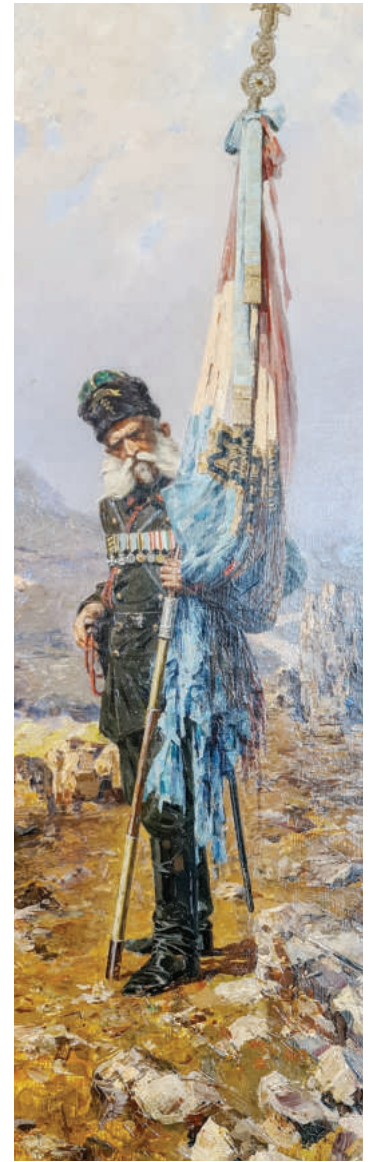
"Самарското знаме" - картина-символ от Ярослав Вешин

Да бяха прелистили тези пишман-родолюбци страниците на вестниците в целия XX век до 1944 г. (издадени са дори в книга), та да видят, че Денят на Освобождението е неподвластен на времето и политическите режими. Да видят как цар Борис III, Богдан Филев и цялата българска власт, сателитна на Хитлер, всяка година на 3 март предвождат народа и останалите живи опъл-