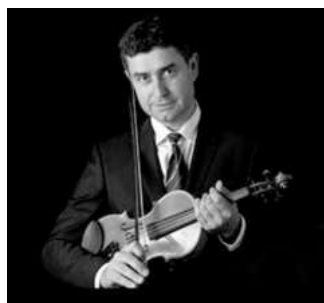
СНИМКА НОВ СИМФОНИЧЕН ОРКЕСТЪР

През 1883 г. вниманието на Брамс се връща към симфонията и той прекарва лятото във Висбаден, композирайки нова (Трета) във фа мажор. През октомври той изсвирва първата и последната част (на пиано) пред Дворжак, който споделя с Николаус Симрок: "Казвам, без да преувеличавам, че това