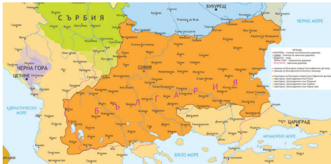
Карта на Санстефанска България

шите политизирани днешни пишман-интелигенти: че всички действия спрямо България - и на СССР, и на Русия след края на войните, са плод на споразумения с другите европейски големи държави. Прословутата руска "окупация" на България е постановена от Великите сили и тя трябва да осигури не друго, а изграждането на самостоятелна българска държава. Санстефанският документ е предварителен договор между Русия и Турция, който обявява Освобождението на България и ни връща на картата на Европа. А ако при ратифицирането му в Берлин през 1878 г. той е променен, териториите на страната ни са орязани и тя е разкъсана на части, това се дължи най-вече на непреклонната намеса на Великобритания и Австро-Унгария, които не искат да допуснат прекалено голямо влияние на Руската империя на Балканите. Всичко това е "заковано" в десетки и стотици архивни документи, но нашите русофоби, клекнали в жалка поза пред днешните "евро-атлантически ценности", се напъват с инсинуации да променят историята и душевността на народа ни. Всеу се моят.