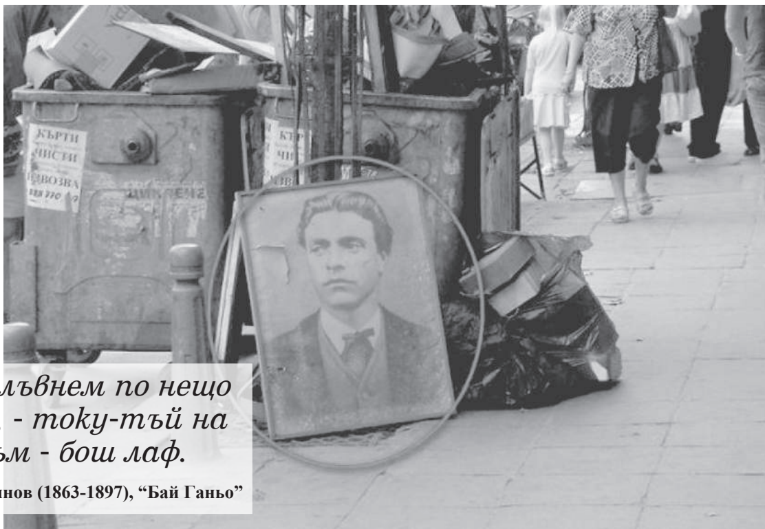
Портрет на Левски на боклука - типичен пример за българския нихилизъм

Алеко Константинов (1863-1897), "Бай Ганьо"