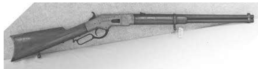
Пушката на Захарий Стоянов

фонда в средата на 50-те години на XX век от Регионалният етнографски музей в Пловдив. Произвежда се през 60-те и 70-те години на XIX г. Оръжието, което Захарий Стоянов носи по време на Априлското въстание, е част от експозиция "Съединение на България 1885 г.", разположена в централната зала на РИМ-Пловдив.