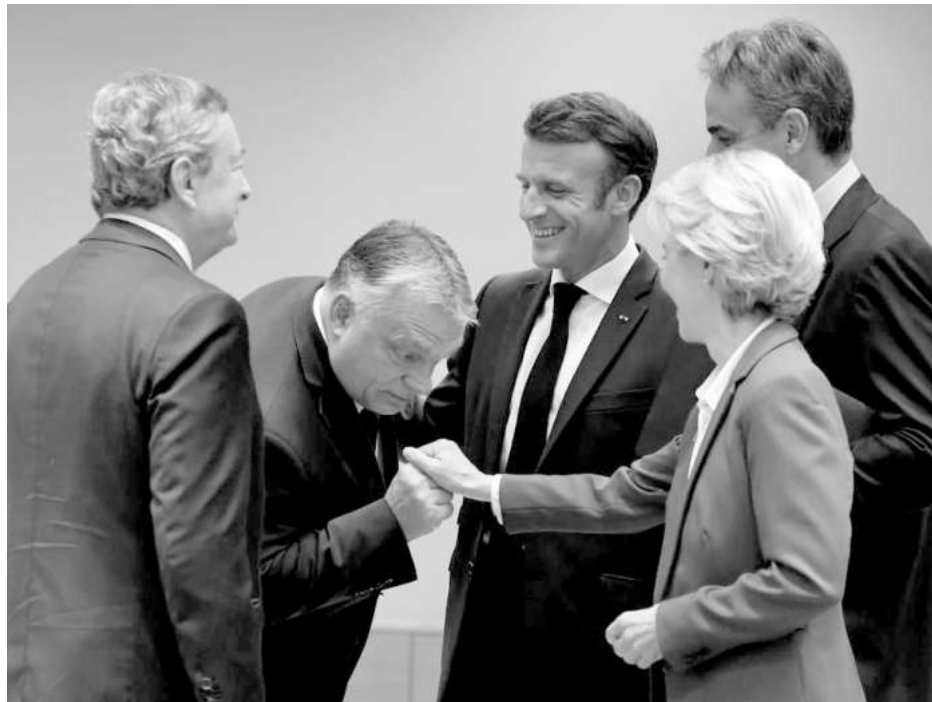
Унгарският премиер е изискан кавалер при срещи с председателя на Европейската комисия Урсула фон дер Лайен. Но в Брюксел е възприеман като "хулигана" на ЕС, който често се отклонява от генералната линия на съюзниците

Европа загуби своята независимост, икономическата и военната си мощ само за една година и Унгария трябва да защитава своите интереси, за да устои на разразилата се буря. Трябва да защити позицията си за