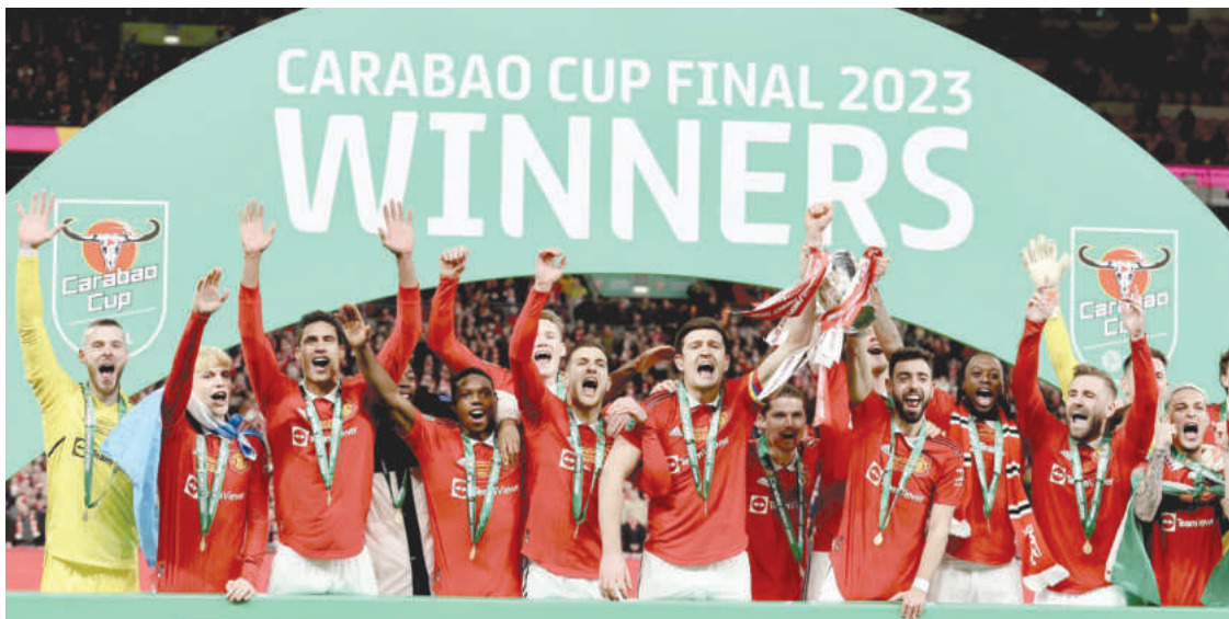
Футболистите на Манчестър Юнайтед се радват с Купата на Лигата. На финала "червените дяволи" сразиха Нюкасъл с 2:0 с гол на Каземиро (33) и автогол на Свен Ботман (39). Това е първо отличие за Юнайтед от 6 години. За последно тимът триумфира в Лига Европа през 2017 г.

При жените Виктория Томова прогресира с 12 позиции до рекордната за нея 87-а със 740 т. Миналата седмица софиянката достигна до II кръг на УТА 1000 турнира в Дубай ($2,8 млн.).