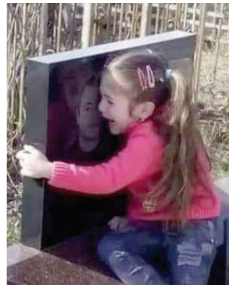
Снимка, която разкъсва сърцето: Донбас. На среща с татко

Полуфабрикатите на медийната сергия не ни ориентират и сантиметър напред в осмислянето на случващото се. Нискокачествена и зле скроена дива военна агитация е превзела ефира. Туктам останаха островчета на нормалността, където темата се обсъжда без