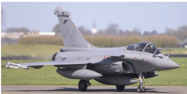
Скоро в сръбското небе ще летят 12 френски изтребителя "Рафал"

По същото време Сърбия получи комплекси за противовъздушна отбрана от Китай и е много вероятно Белград да купи бойни самолети и от Пекин. Засега обаче Вучич се въздържа от тази сделка, страхувайки се от негативната реакция на САЩ и ЕС.