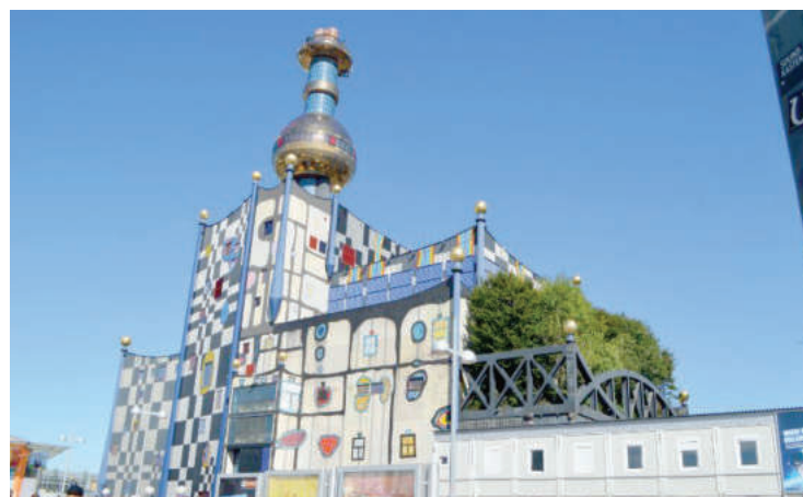
Съоръжението във Виена, което е модел на Столичната община

Основният компонент е Заводът за механично-биологично третиране на битови отпадъци и производство на РДФ