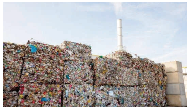
РДФ горивото чака да бъде изгорено в циментовите заводи

изграждането на съоръжение за изгаряне на така наречения РДФ отпадък на столицата остана някак встрани от общественото внимание покрай злободневните политически вълнения. Проектът за спорния инсинератор за изгаряне на смет обаче беше единственият вариант на Столичната община да се справи с голяма част от проблема - какво да правим с генерирания от най-големия град в България боклук?