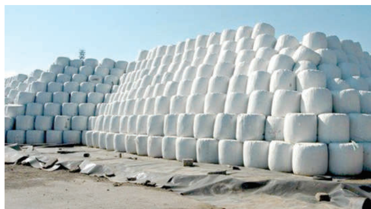
А някога имаше и бали

гориво край софийското село Яна, открит през 2015 г. след много отлагания. Тогава бе закрита наказателната процедура срещу страната за неправилно прилагане на европейското законодателство при управлението на отпадъци.