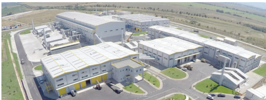
Заводът за преработка на боклука на града

Именно РДФ е абривиатурата, от която вече се плашат и гартите. Инсталацията за оползотворяване на въпросното гориво обаче остава химера, стана ясно преди дни. Въпреки че години наред се работеше и спореше по нея, призоваваше