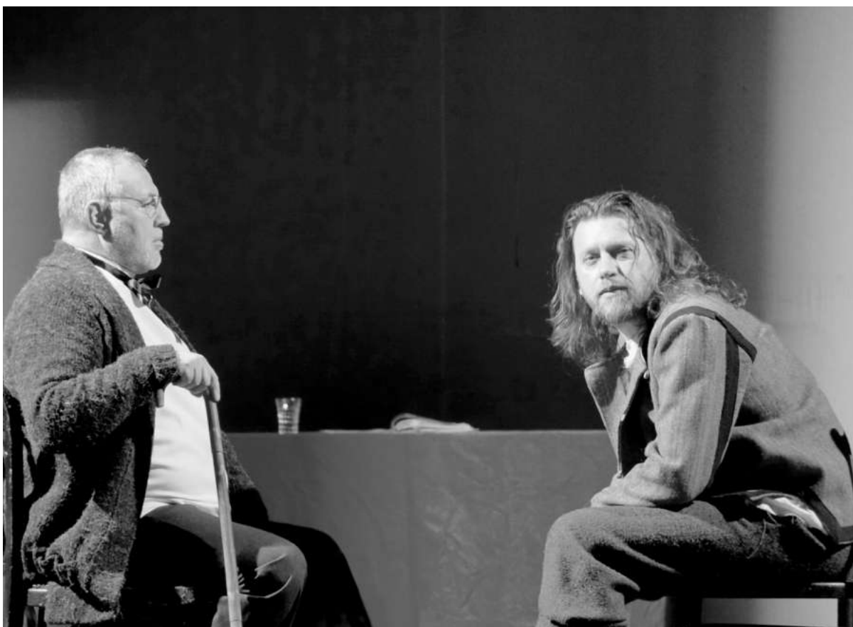
По повод 150-ата годишнина от гибелта на Васил Левски жителите на град Левски имаха възможност да гледат театралната постановка "Разпитът" в две представления в Народното читалище "Георги Парцалев-1901". Постановката е част от Националната кампания за съхранение, развитие и популяризиране на българската история и култура