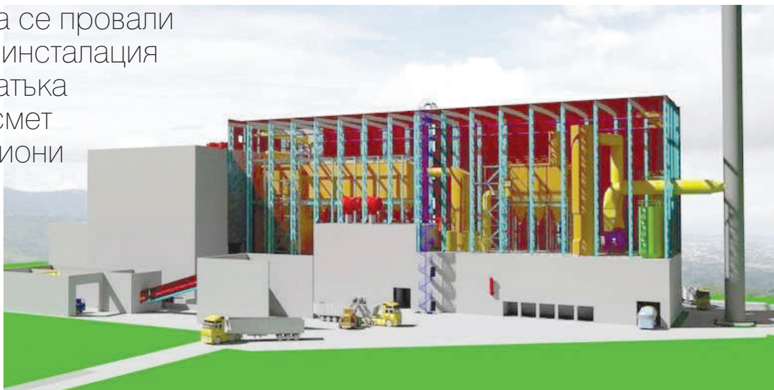
Така трябваше да изглежда инсинераторът в София

Провал на мегапроект за оползотворяване на сметта на София, милиони изгубени евросредства и безизходна съпровождат последните месеци от управлението на ГЕРБ в София. Признатата преди седмица несполука с усвояването на европари за