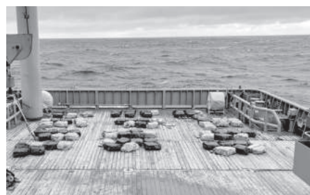
Полицията в Нова Зеландия откри огромна пратка наркотици, плаваща в Тихия океан. Тя съдържа 81 бали кокаин, тежи 3,2 т и е на стойност около 316 млн. долара. Разследващите смятат, че дрогата е захвърлена в "плаваща транзитна точка" в океана. Върху някои от балите е изобразен Батман. Количеството е достатъчно за употреба за 30 г. Произходът на наркотиците не е известен

Повече от 30 автомобили са сблъскаха в сряда сутринта в северо-западната китайска провинция Гансу поради лоши метеорологични условия, свързани със снеговалеж. В резултат някои автомобили са се запалили. Сред шофьорите и пътниците има пострадали. На мястото на инцидента са пристигнали медици, полиция, пожарникари.