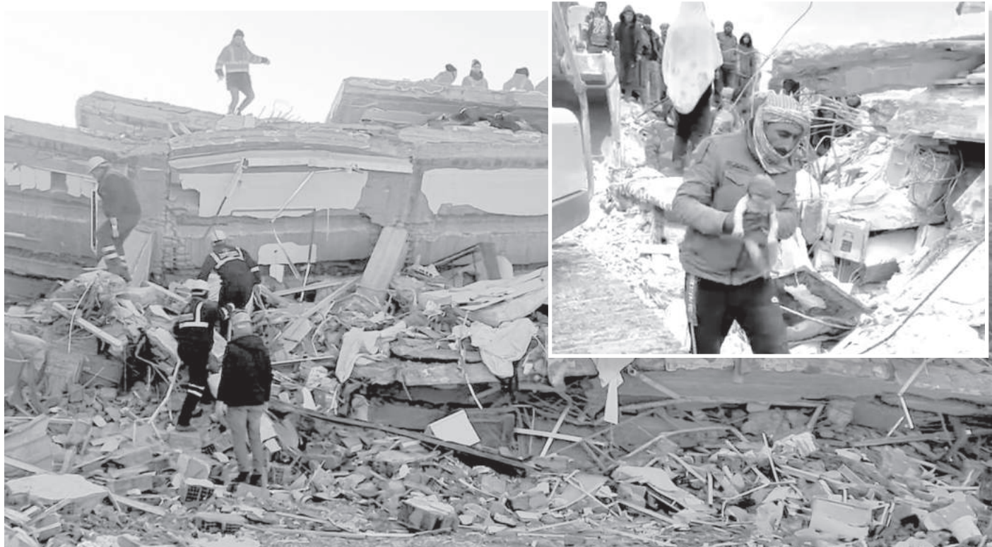
50-60% от сградите в град Нурдаг са напълно разрушени. Спасителни екипи продължават да търсят оцелели. На много места в района няма ток и вода. Междувременно в Сирия доброволец изроди бебе, чиято майка почина под руините след раждането