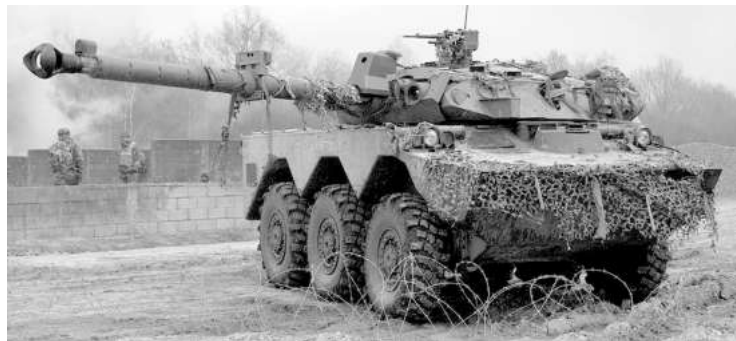
Колесен танк AMX-10 RC

Според военни експерти използването на AMX-10 RC в Украйна изглежда доста съмнително поради слабата му проходимост. Много е вероятно колесното превозно средство банално да затъне в калта извън пътищата.