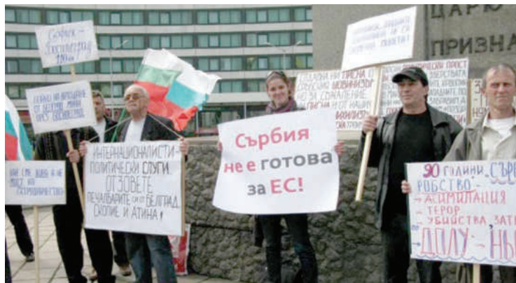
Делегация от Босилеград протестира пред Народното събрание срещу капитулантската политика на ГЕРБ, която вдигна евробариерата пред Сърбия, но без гаранции за првата на българите в Западните покрайнини

Вместо с престъпността, полицията гони българските духове. В сравнение с времето на Милошевич, сега даже е още побудна за всяка публична проява на българско самочувствие.