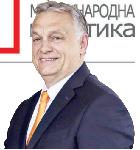
ВИКТОР ОРБАН :