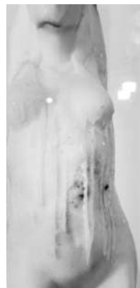
СНИМКА ГАЛЕРИЯ „+359“

Галерия „+359“ (ул. „Галичица“ 13-а, ж.к. „Лозенец“) кани на откриването на изложбата „Пластични метаморфози“ - проект на Георги Тодоров, куратор Консто Касабов, на 12 януари от 18 ч. Поради спецификата на проекта, може да посетите изложбата на 12.01, 13.01, 19.01, 20.01, 02.02, 03.02, 09.02, 10.02 от 16,30 до 19 ч. Тази съвременна скулптурна експозиция представлява творческото търсене на автора в посока на пластичната интерпретация и метаморфоза на един и същи обект, чрез различни подходи към формата и визуалната естетика. Всяка творба представлява восьчна женска фигура с метален скелет, който варира като форма, детайл и концепция съответно при всяка от трите работи. Авторът интерпретира темата за повърхностното и дълбокото, както и за често лъжливата и подмамваща външност, изследвайки добре познати понятия като видимо и невидимо, класическо и съвременно. Ключов концептуален момент играе разтапянето на восьчната обвивка и показването на металната вътрешност, в конкретния случай - скелета на фигурата.