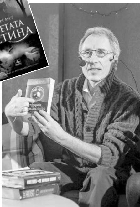
СНИМКИ ИЗДАТЕЛСТВО „ПЕРСЕЙ“