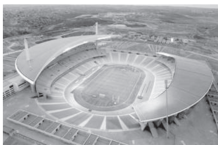
Олимпийският стадион "Ататурк" в Истанбул ще приеме финала на Шампионската лига на 10 юни