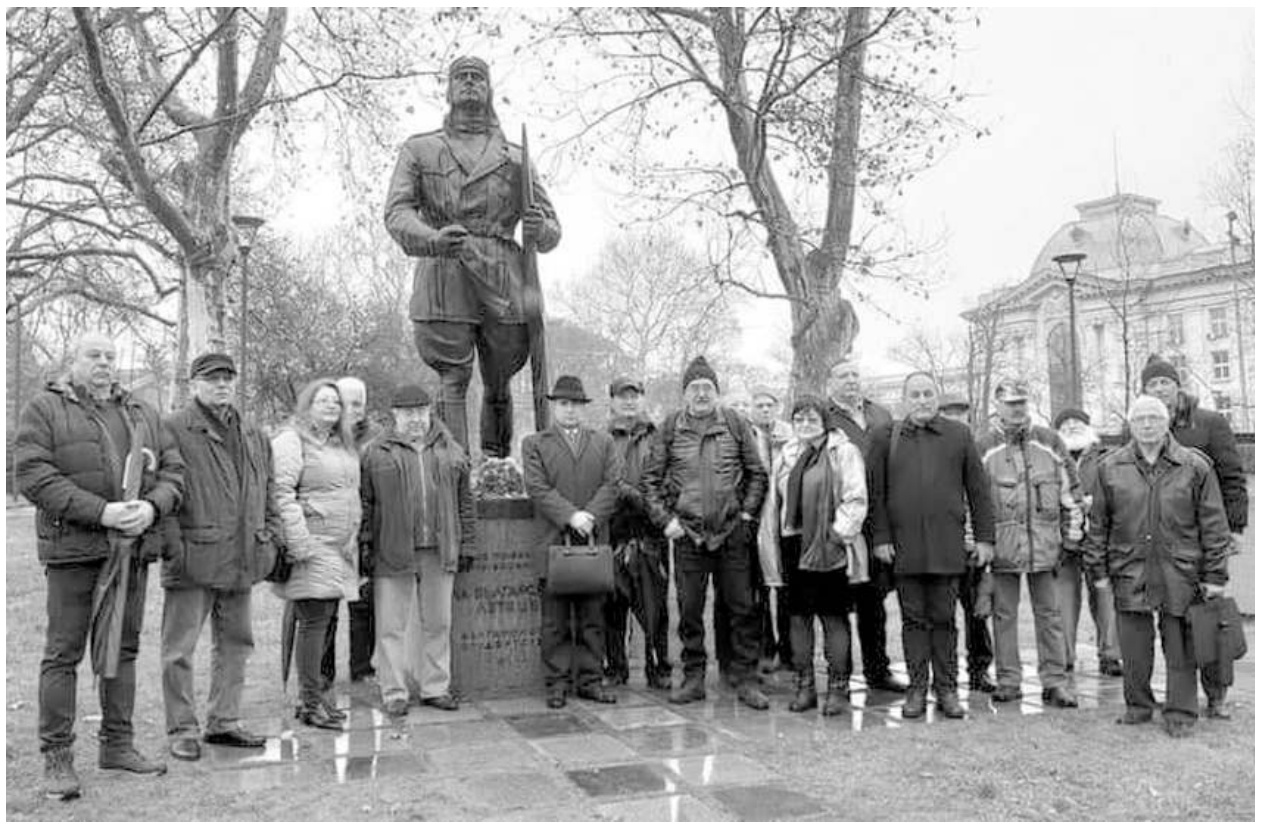
Социалисти и членове на БАС почетоха паметта на невинните жертви на англо-американските бомбардировки над София на 10 януари 1944 година, когато загиват стотици мирни жители. Те поднесоха цветя пред Паметника на българските летци и парашутисти, загинали героически във войните 1912-45 г.

Страната ще се раздели на три зони - от Южната част на Стара планина и Северната част на Стара планина, за да може да се покрива периметър и да се стига навреме. Базите вероятно ще са около Пловдив, Ямбол, Сливен, Варна, Шумен, Плевен, Долна Митрополия.