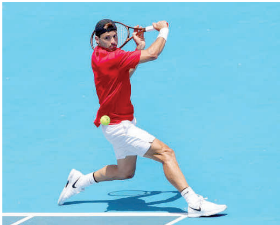
Григор Димитров връща топката от бекхенд за победата над Борна Чорич в Мелбърн

Григор Димитров (№29 в света) победи Борна Чорич (Хър, №23) със 7:6 (5), 7:6 (3) на старта на демонстративния турнир по тенис Kooyong Classic в Мелбърн, Австралия. Двубоят продължи 1:46 часа и се игра в комплекса, където в понеделник започва "Аустраелиън Оупън".