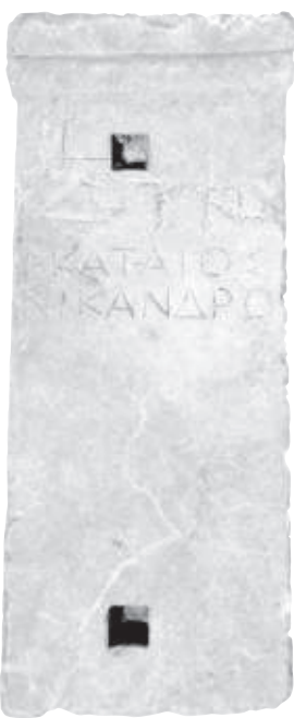
Находка от Созопол

Археолозите от Националния исторически музей проведоха теренни археологически изследвания на шестнадесет обекта. Проучванията се осъществиха с финансовата подкрепа на Националния исторически музей, Министерството на културата, средства от програма "Култура" на Столичната община и местните общини, и частни спомоществатели. Географският обхват на изследванията се разпростира от Родопите през Сакар до