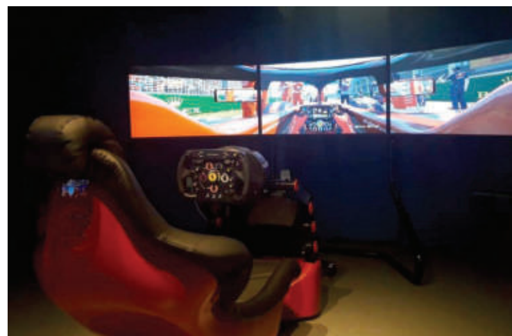
СНИМКИ ИНТЕРАКТИВЕН МУЗЕЙ НА ИНДУСТРИЯТА В ГАБРОВО

Разходката завършва в луксозния 3D киносалон на музея с друго впечатляващо изживяване - триизмерен филм за Габрово. Част от кадрите показват града от птичи поглед, както и други забележителности в околността - Регионалният етнографски музей на открито "Етър", Музея на архитектурно-историческия резерват "Боженци", Соколския манастир и други. Интерактивният музей впечатлява със своята елегантна архитектура, модерен дизайн, богато тематично съдържание, съвременни експозиционни технологии и атрактивни аудио-визуални приложения. Обиколката му е еднакво вълнуваща както за децата, така и за възрастните, отбелязват за ДУМА от институцията.