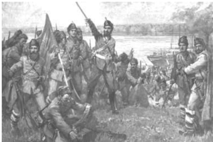
Ботевата чета слиза на българския бряг при Козлодуй, художник Димитър Гюдженев