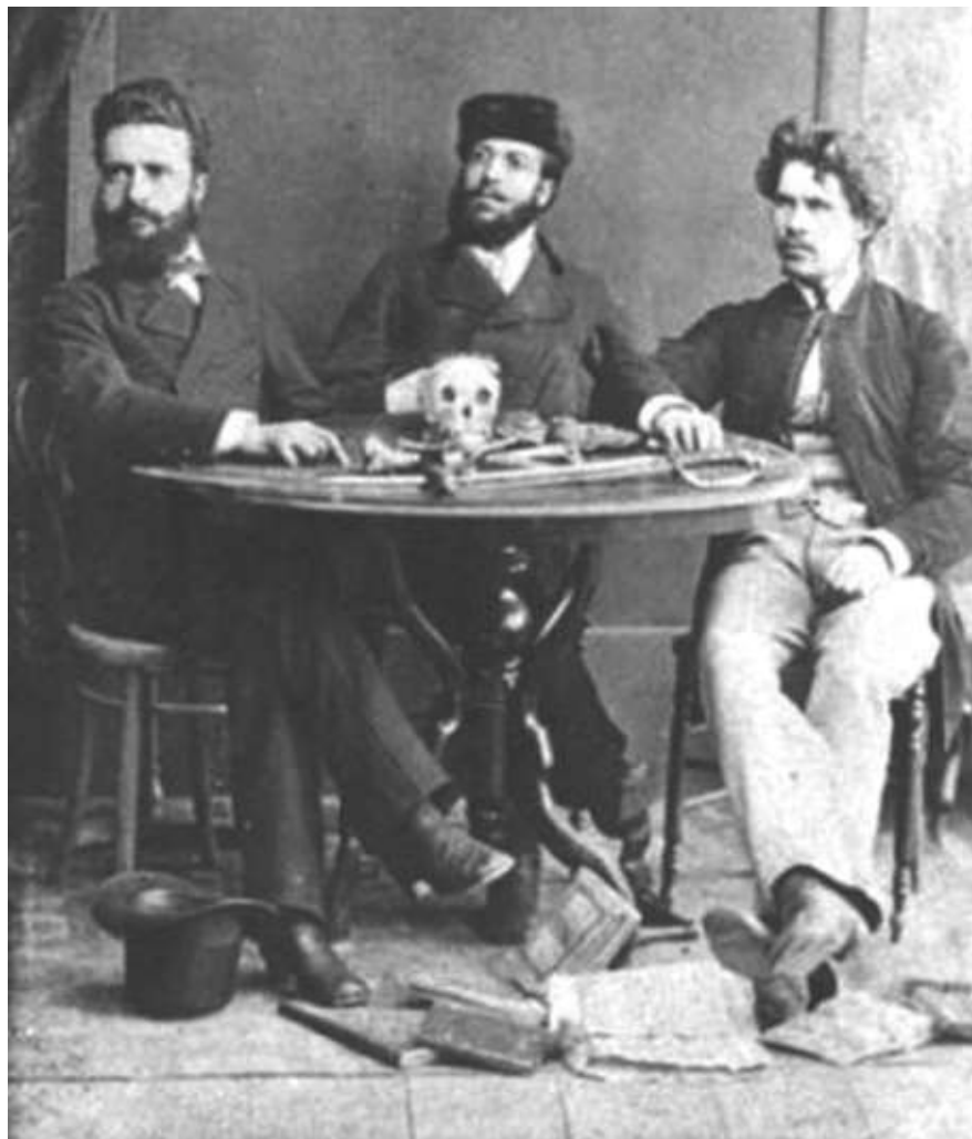
Христо Ботев с Никола Славков и Иван Драсов в Румъния, 1875 г.

Свещена глупост! Векове цели разум и совест с нея се борят; борци са в мъки, в неволи мрели, но, кажси, що са могли да сторят! Светът, привикнал хомот да влачи, тиранство и зло и до днес тачи; тежка желязна ръка целува, лъжливи уста слуша със вяра: мълчи, моли се, кога те бият, кожата да ти одере звярът и кръвта да ти зми изпият, на бога само ти се надявай: "Боже, помилуй - грешен съм азе", думай, моли се и твърдо вярвай - бог не наказва, когото мрази... Тъй върви светът! Лъжа и робство на тая пуста земя царува! И като залог из род в потомство ден и нощ - вечно тук преминува. И в това царство кърваво, грешно, царство на подлост, разврат и сълзи, царство на скърби - зло безконечно! кипи борбата и с стъпки бързи върви към своят свещени конец... Ще викнем ние: "Хляб или свинец!"