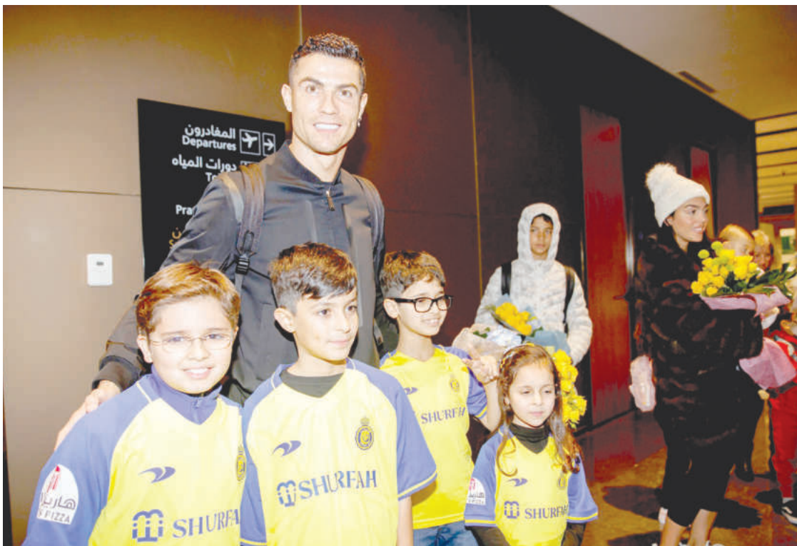
Кристиано Роналдо и семейството му бяха посрещнати от деца на летище в Рияд, което е само за членове на кралското семейство и политически лидери

Роналдо може да дебютира още утре, когато новият му тим има мач с Ал-Тае.