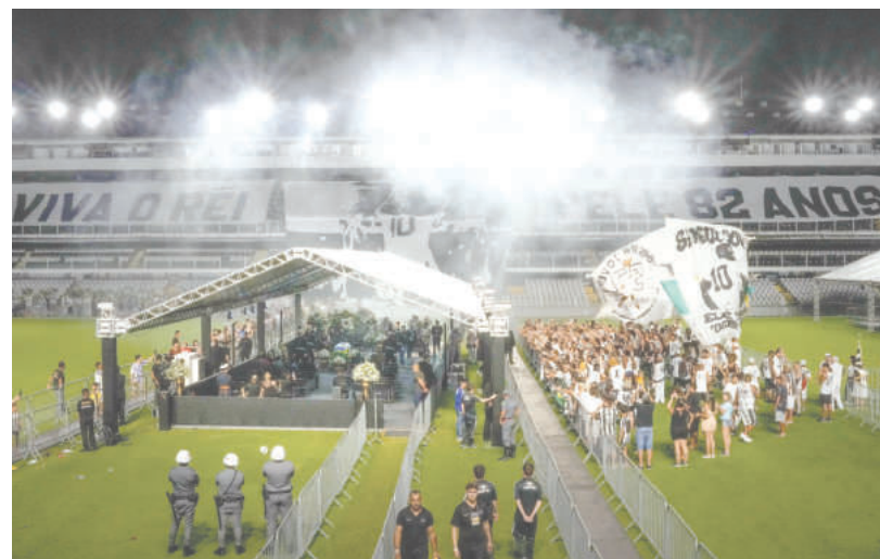
Над 150 000 души, включително президентът на Бразилия Луис Инасио Лула да Силва, изпратиха легендата Пеле

"Бях при него на 21 декември. Беше спокоен, поговорихме си малко, но вече разбрах, че усеща, знае, че ще си тръгне. Той беше много верен, каза: "Всичко е в ръцете на Господ". И аз му казах: "Вярно е, той знае кога е дошло времето", обяви Мария Лусия.