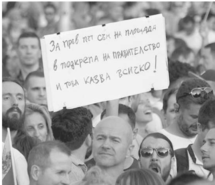
Момент от протеста в подкрепа на правителството, 22 юни 2022 г.

поне повечето от тях, които очакваха "изчегъртване", по неговия израз, а той влезе в сговор с ГЕРБ и изчегърта правителството. ИТН се оказа част от задкулисието, с което уж се бори. Лансира един офшорен ковчежник, участвал в схеми