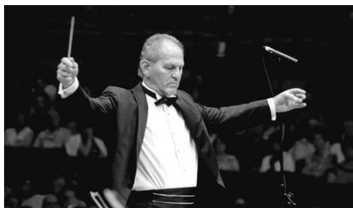
СНИМКА СОФИЙСКА ФИЛХАРМОНИЯ

кариера, свързана с много от най-големите концертни зали по света. Редовен гост-солист е на оркестри от най-висока класа. Солира под палката на именити диригенти. От 2000 г. ръководи и дирижира ансамбли и оркестри в България, Франция, Полша, Корея, Япония и Швеция. Притежава изключително широк репертоар, вариращ от барока до съвременната музика и популярните жанрове.