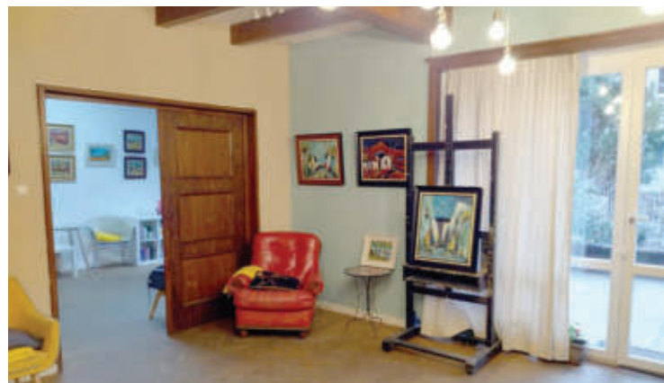
Атмосферата в "Къщата на София" предполагаше домашен уют и комфорт