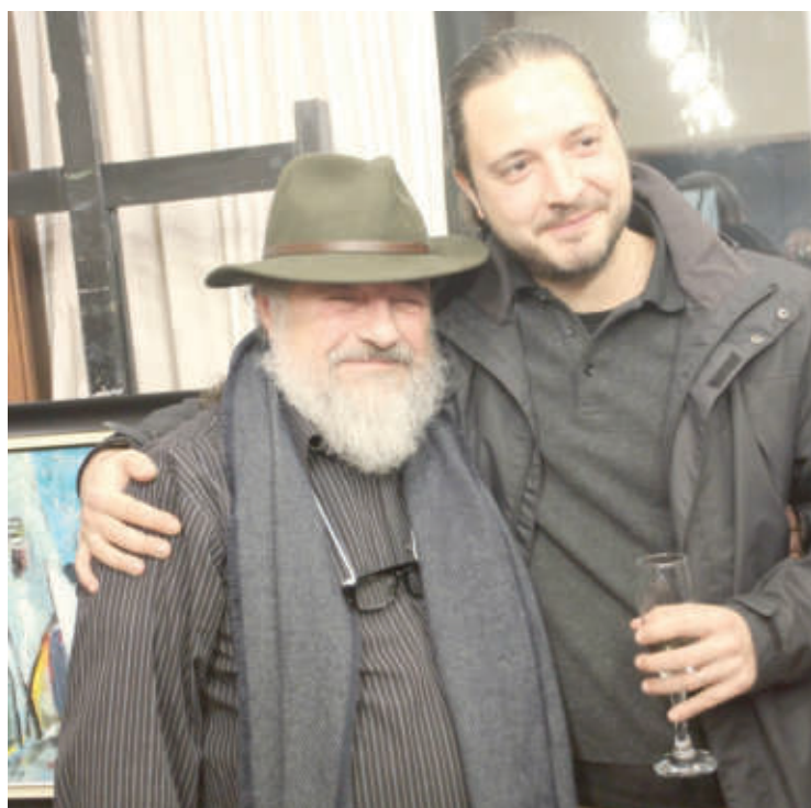
Синът му Юлиан се чувства голям късметлия с такъв баща, от когото е наследил таланта си