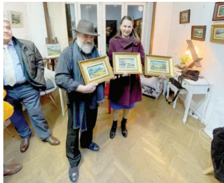
Някои от гостите си купиха повече от една картина