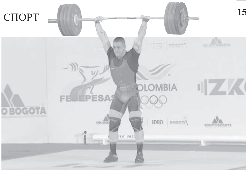
Карлос Насар изтласква 220 кг, с които постави световни рекорди за мъже и юноши