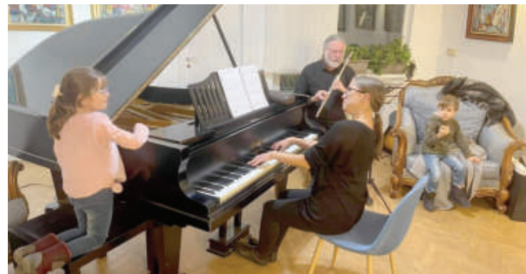
Класическите музикални изпълнения на пиано и флейта обогатиха прекрасната вечер