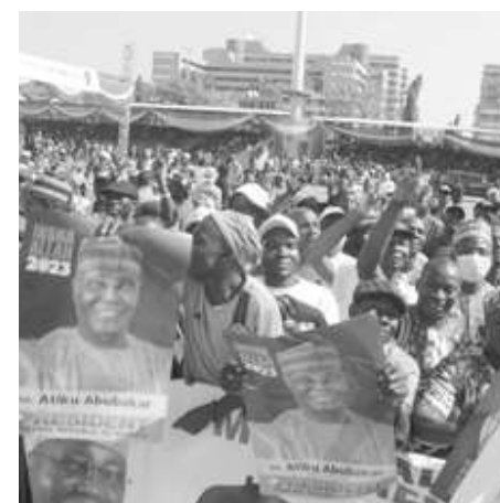
Кампанията за президентските избори в Нигерия е в разгара си. Въпреки че врътът е догодина, народът не крие предпочитанието си към Атику Абубакр, издигнат от Народната демократична партия

Снеговалеж затвори и двете писти на летището в Манчестър. Наложиха се пътници да отменят пътуванията си и да чакат часове на аерогарата. Някои предпочетоха да им възстановят стойността на билета.