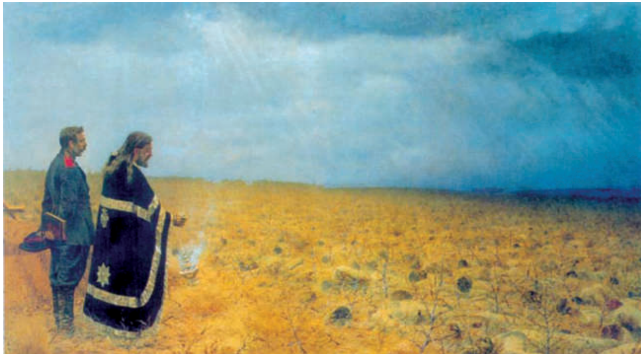
Победените. Панихида, 1878-1879 г. Картината е дело на руския художник Василий Верешчагин, участвал в Руско-турската освободителна война. Показва водена от православен свещеник и руски офицер панихида за стотиците загинали и все още непогребани на бойното поле край Горни Дъбник