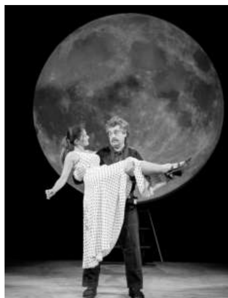
СНИМКА ТЕАТЪР „БЪЛГАРСКА АРМИЯ“