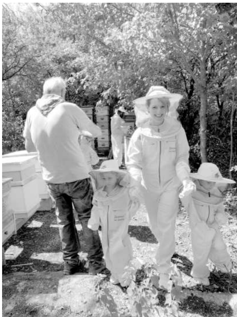
Приключи проектът "Детска бригада" за пчеларство и градинарство за деца на сдружение "Европейски инициативи без граници" и образователен център "Дворецът на децата". Той е част от програма "Знание и растеж", финансиран от Общинска фондация "Русе - град на свободния дух". Над 410 деца работиха по различни дейности в градината и пчелина