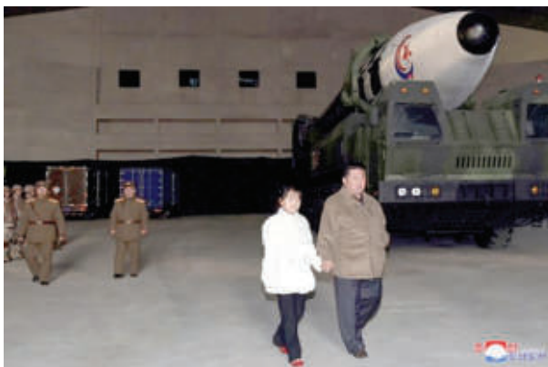
Лидерът на Северна Корея с малката си дъщеря на изстрелването на междуконтинентална баллистична ракета

"Да, вицепрезидентът е дълбоко загрижен. И това е една от причините, поради които тя иска да събере тази група и заедно да осъдят опасните действия", каза служителят на администрацията.