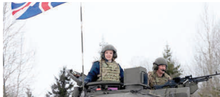
Бившият премиер Лиз Тръс се качи на танк, демонстрирайки готовността си да воюва с Русия