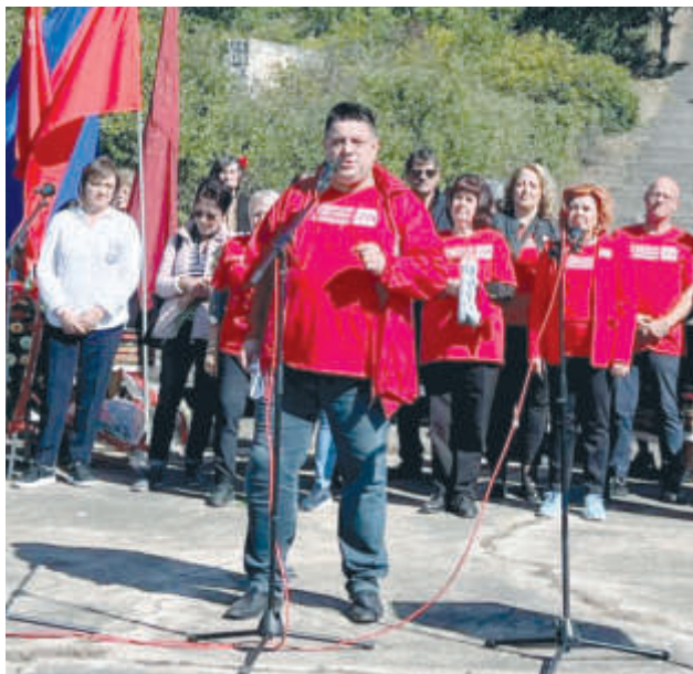
За мен е истинска чест и предизвикателство да бъда водач на листата на

Надежда за по-добро утре, надежда за мир, равенство и социална справедливост. Това са темелите на нашата партия, а вие сте хората, които олицетворяват тази надежда.