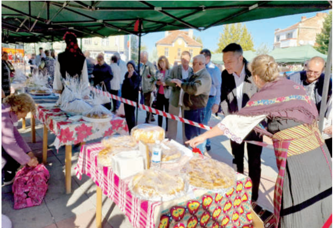
Водачът на листата на БСП в Пловдив и Ямбол Кристиан Вигенин присъства на празника на баницата в Елхово. Той разговаря с десетки хора, които се интересуваха от решаването на проблемите, свързани с високите цените и галопиращата инфлация. Елховчани изразиха своята подкрепа за кандидатите на левицата и им пожелаха успех

“В тези трудни за България времена са необходими политици с опит, биография и сериозни политически сили. Надявам се да спрем да си правим експерименти с държавата, с хора, които не могат, с шоумени, с различни проекти едnodневки”, категоричен е Божанков.