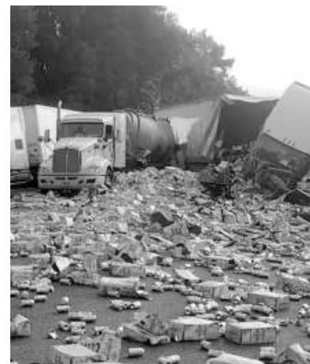
Кенчета бира се разпиляха по магистрала в американския щат Флорида, след като два тира се сблъскаха

Супертайфунът Нору приближава Филипините и се очаква да връхлети гъсто населения главен остров Лусон. Това наложи евакуацията на крайбрежните градове, съобщиха местните власти. Стихията е с максимална постоянна скорост на вятъра от 195 км/ч.