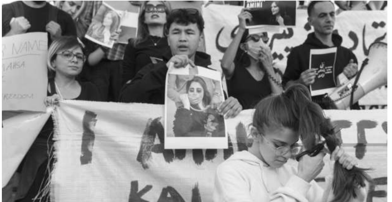
Протестите в Иран заради смъртта на 22-годишната Махса Амини продължават вече цяла седмица и имат международен отзвук. В Гърция млада жена си отрязва косата по време на демонстрация. Иранският президент Ебрахим Раиси определи размириците като бунт и обеща да вземе решителни мерки

Представители на редица изселнически асоциации твърдят, че сега ще върви по-гладко, тъй като има инициатива по подготовка за предстоящия вот, в рамките на която са информирали избирателите за подробности за машинното гласуване. Разпространени са клипове, обясняващи как се гласува.