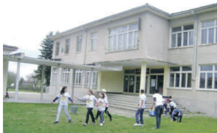
ОУ "Св. св. Кирил и Методий" в с. Сокол

съвет с познатите мотиви. В първото школо учениците са били едва 31, а във второто - 47, всички в слети и маломерни паралелки с общо дофинансиране от над 36 000 лева за година.