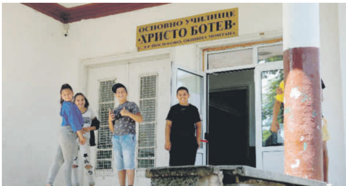
ОУ "Христо Ботев" в с. Д-р Йосифово, Монтанско

Три от закритите школа с решение на МОН по предложение на общинските съвети са в Разградско, а две - в Силистренско.