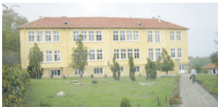
ОУ "Христо Ботев" в с. Николаевка

От първи до седми клас учеха и децата в две училища в Силистренско, които ще останат тихи на 15 септември - ОУ "Св. св. Кирил и Методий" в с. Сокол и ОУ "Отец Паисий" в с. Стефан Караджа в община Главиница. Решението за затварянето им е взето от Общинския