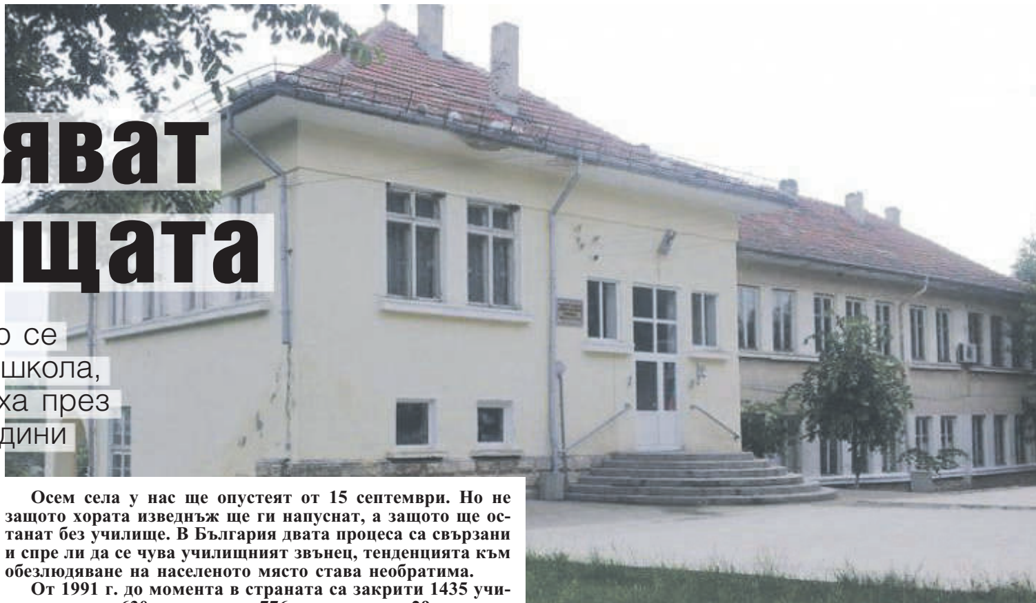
ОУ "Кирил и Методий" в разградското село Киченица

През миналата учебна година класните стаи останаха завинаги затворени само в две населени места, за предходната - в цели 16, а за следващата - в 8. Очевидно посоката е една, макар че крачките към края са неравномерни.