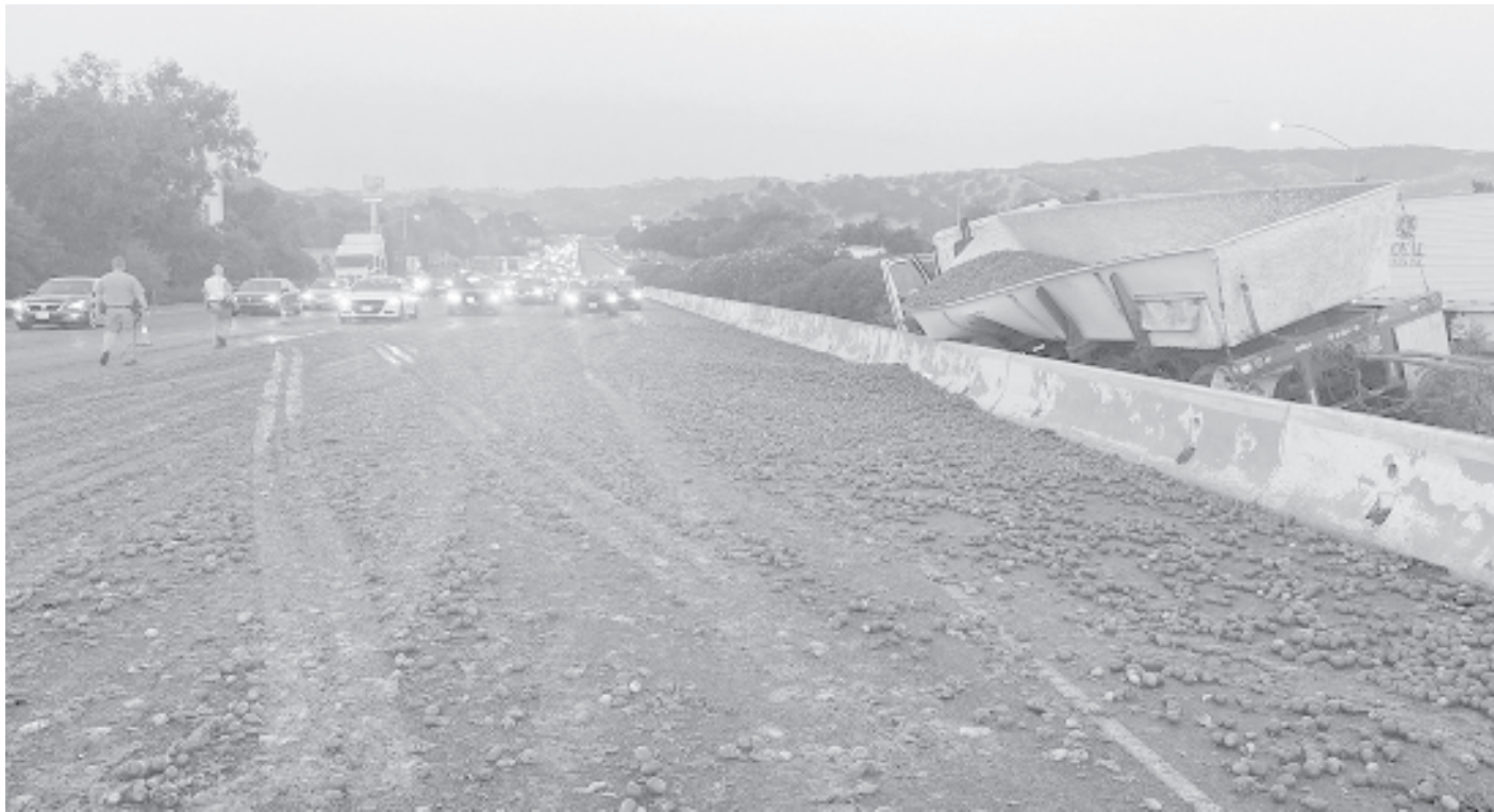
Товарен камион, превозващ домати, катастрофира след сблъсък по магистрала 80 в северната част на щата Калифорния. Товарът се разпръсна върху няколкото платна на магистралата. Източната част от магистралата бе почистена, но западната остана затворена шест часа след катастрофата