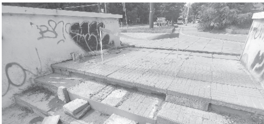
В очакване на действия от кмета на „Триадица“, жители на района сами започнаха да ремонтират вход към подлез на бул. „Гоце Делчев“

Екоинспекцията уверява, че следи състоянието на атмосферния въздух и ежедневно публикува информация от двете автоматични станции.