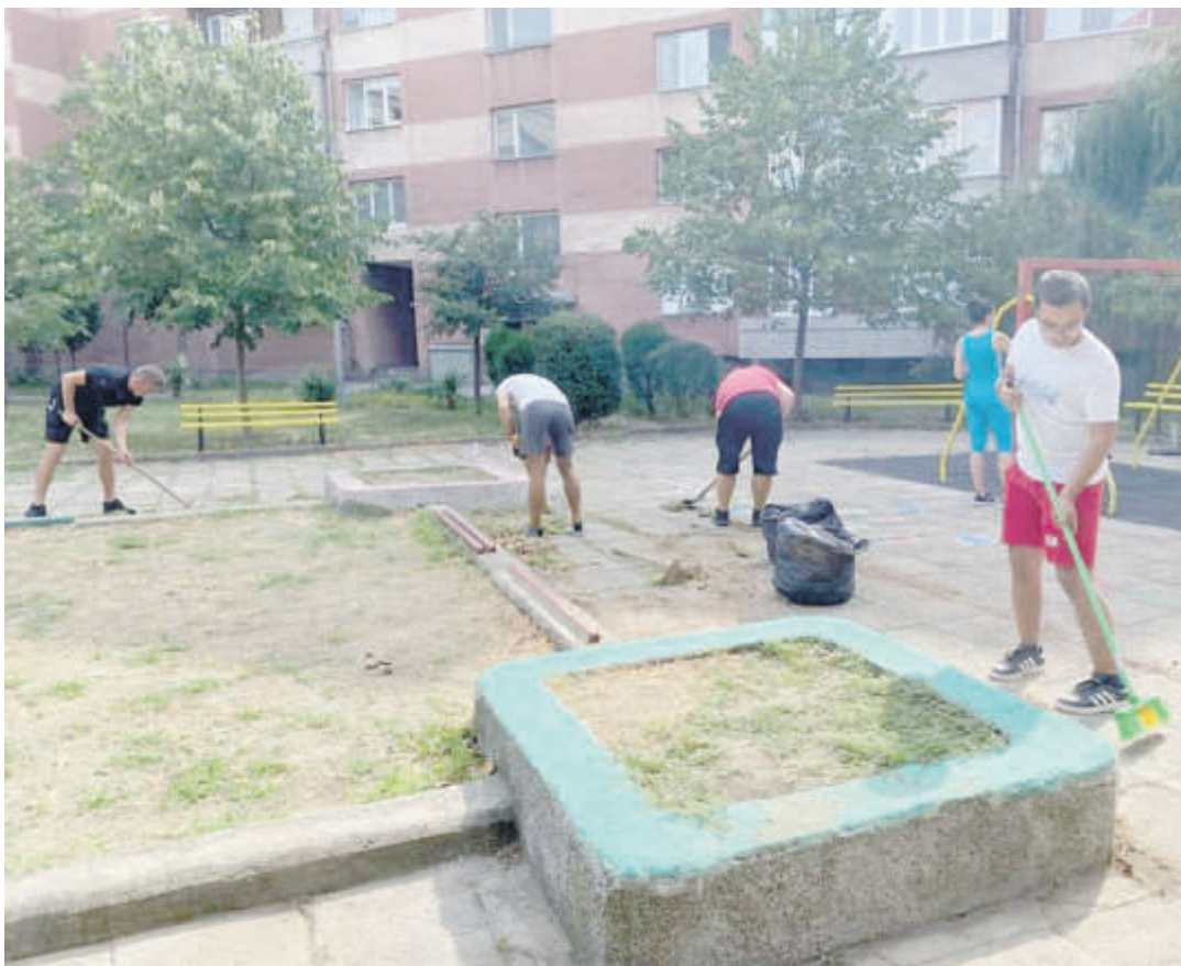
Младежкото обединение в БСП в Сливен почисти и освежи детска площадка в централната част на града. “В града се направиха много нови детски площадки, но те са предимно в кварталите. Децата в централната част на града нямат чисти и поддържани площадки, на които да се забавляват. Затова и ние решихме да ги зарадваме като направим нещо за тях”, заявиха от обединението

“Това, което предлага Трифонов, не може да стане. Член първи от българската конституция казва, че България е парламентарна република. Не може да има полубременна жена. Трифонов е виновник за буксуването на страната. Най-добре е да очисти политическия терен. ИТН саботираха всяка стъпка на правителството”, коментира вчера съпредседателят на ДБ Атанас Атанасов.