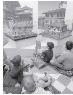
СНИМКА ИЕФЕМ - БАН

Малко преди началото на учебната година, в Националния етнографски музей ще започне есенна школа за деца от 7 до 13 години, съобщава БТА. Школата започва на 5 септември и ще продължи до 9 септември, всеки ден от 9,30 до 16,30 ч. Децата ще се запознаят с различни майстори и ще изработват изделия, които ще останат за тях. Забавлявайки се, те ще научат много неща за традицията, културата и бита на нашите предци. Включването в групата е по реда на записване на участниците. С оглед безопасността и ефективността на заниманията, групата ще наброява не повече от 15 деца