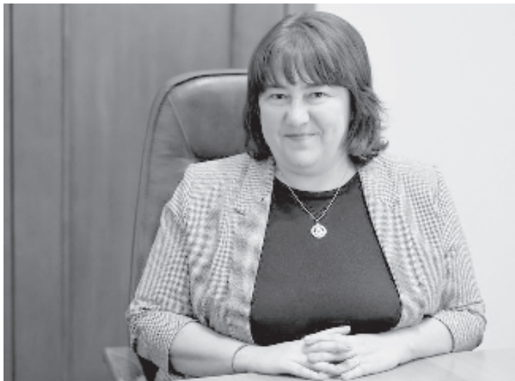
Финансовият министър Росица Велкова

“Ако данъчното събитие по доставката (датата, на която плащането е станало дължимо), е възникнало до 08.07.2022 г. включително, ще е приложима стандартната ставка от 20% за доставката,