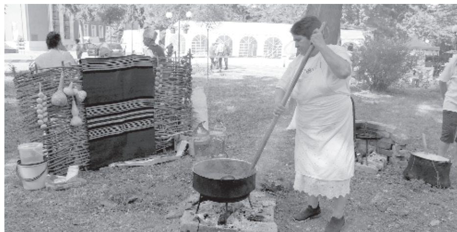
Фестивалът "Пълнената чушка - най-вкусната левченска традиция" се състои в събота в парковата зона до община Левски. Третото издание на кулинарния фестивал показва, че българската кулинарна традиция живее в сърцата и домовете на хората, но и вдъхновява и обединява в името на благородни каузи. На събитието се събраха средства за изработването на скулптурна композиция "Земляците" с фигури на Георги Парцалев, Дончо Цончев и Григор Вачков

менят учебната си документация и програмите в училище, но директори вече се оплакаха както от кратките срокове, така и от технически грешки в указанията на МОН. Те са недоволни и защото ще им се наложи да търсят нови преподаватели. Очаква се промените да доведат до увеличение с 4 млн. лева годишно на разходите за лекторски възнаграждения или допълване на нормите преподавателска работа на учителите по български език и литература, математика и география и икономика.