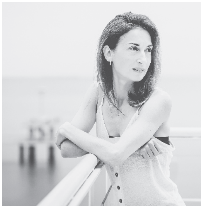
СНИМКИ PLOVDIV JAZZ SUMMER