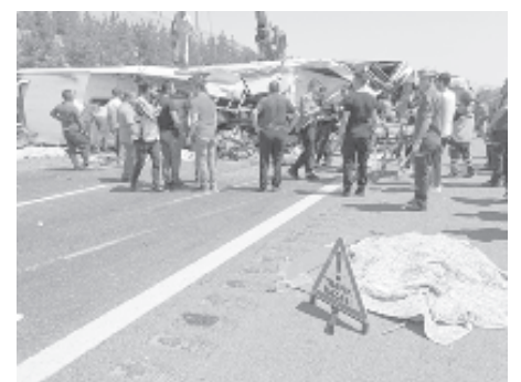
Турски служители оглеждат мястото на 20-ия километър от магистралата Газиентеп-Низип, където в събота се преобърна автобус. Загинали са 16 души и над 20 са ранени. Часове по-късно в турския град Мерик камион с отказали спирачки се връза в минавачи. Загинали са над 16 души, а 29 са ранените, 8 от които тежко. Заради големия брой жертви турски медии нарекоха 20 август "черната събота"

Перуански лидер на неуспешното етнонационално въстание от 2005 г. Антауро Умала бе освободен от затвора, след като излежва присъда за лидерство на бунта. 59-годишният Умала е брат на бившия президент Олянта Оланта, който многократно отказа да го помилва, докато заемаше президентския пост. Антауро бе лидер на т.нар. Етнокасеристко движение, което се застъпва за завземане на властта от коренното население.