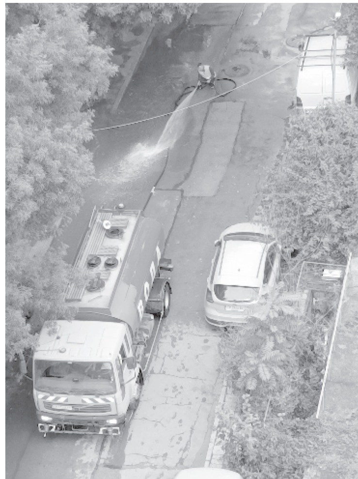
Жителите на столичния квартал "Света Троица" останаха изненадани вчера от решението на общината да бъдат измити улиците веднага след силния дъжд няколко часа по-рано

Междувременно стана ясно, че общината не може да се справи за пореден път със сроковете за започналите вече улични ремонти. Няма никаква яснота кога ще бъде отворено движението по част от трасето на трамвай номер 5 по бул. "Цар Борис III", което се ремонтира от пролетта на 2021 г. Завършването на участъка от Съдебната палата до трамвайното ухото при бул. "Братя Бъкстон" се отлага вече с месеци. Едно от извиненията на кметството е, че това се дължи на забавянето на различни доставки на материали за обекта, свързано с КОВИД-пандемията и войната в Украйна.