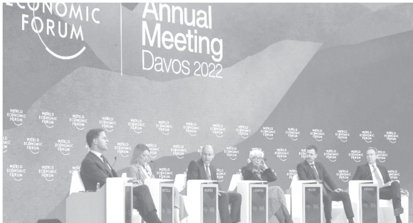
Форумът в Давос тази година мина под знака на войната в Украйна и задаващата се продължаваща криза в света

Но с фразата, че нашата цивилизация може да не преживее третата световна война, Сорос явно е калкулирал в сметките си срещу Путин и ядрената фаза на войната - примерно ограничен ядрен конфликт или размяна на мини-ядрени удари. Нищо чудно на геополитическата борса той вече да е заложил на ядрен сблъсък. Спекулант е