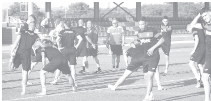
За пръв път националите на България се готвят толкова дълго в Разград

"Надявам се на голям фенски интерес. Ако не си поставяме големи цели, не виждам как ще израстваме като отбор. Целта досега