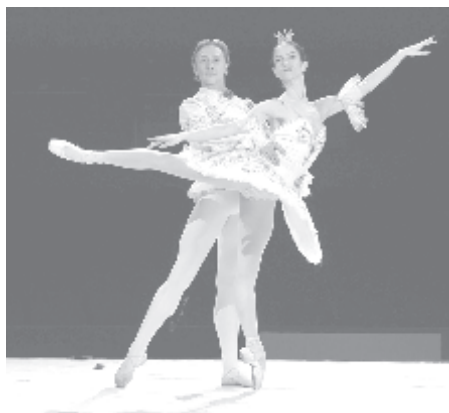
СНИМКА ДО - СТАРА ЗАГОРА

Премиер солистът на Виенската опера ще бъде принц Дезире в спектакъла на Старозагорската опера на 31 май в зала 1 на НДК