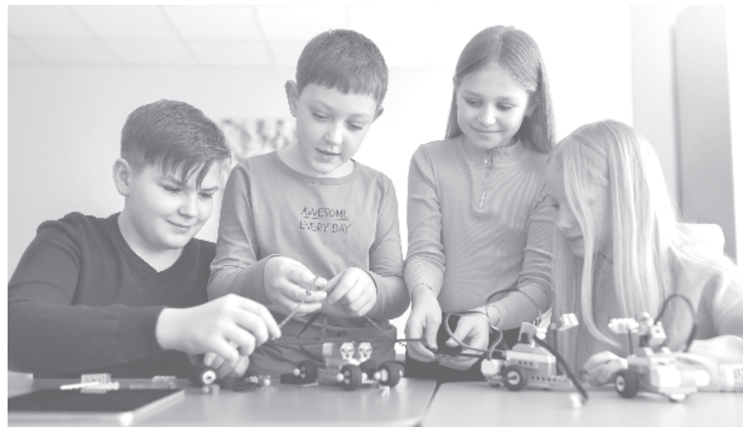
Проектът е финансиран по програма "Знание и растеж" 2022 на фондация "Русе, град на свободния дух"

В Регионалната библиотека "Любен Каравелов" в Русе отвори врати академията по електроника, програмиране и 3D моделиране за 60 ученици от 10 до 17 г. Тя се реализира по проект "Свят от технологии - Фабрика за