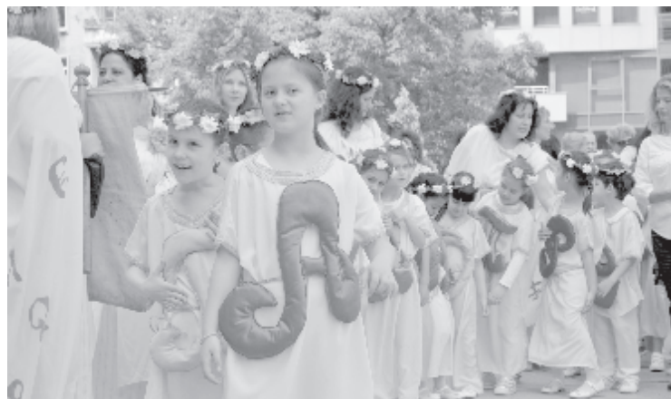
В Русе ученици поведоха празничното шествие