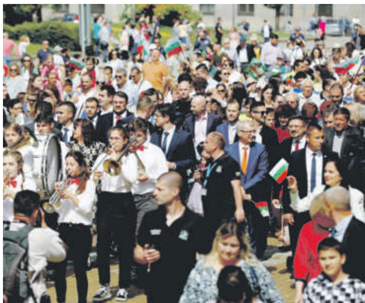
В шествието в София се включиха хиляди ученици, както и премиерът Кирил Петков

Посланикът на САЩ у нас Херо Мустафа също отправи поздравление по случай 24 май. "Благодарим Ви, български учители! Вие сте наследници на братята Кирил и Методий, вие сте тези, които прославят и пазят тяхното дело. Вие сте тези, които вдъхновяват, образоват и отварят вратата към бъдещето на нашите деца. От името на всички нас - огромно благодаря!" каза Мустафа.