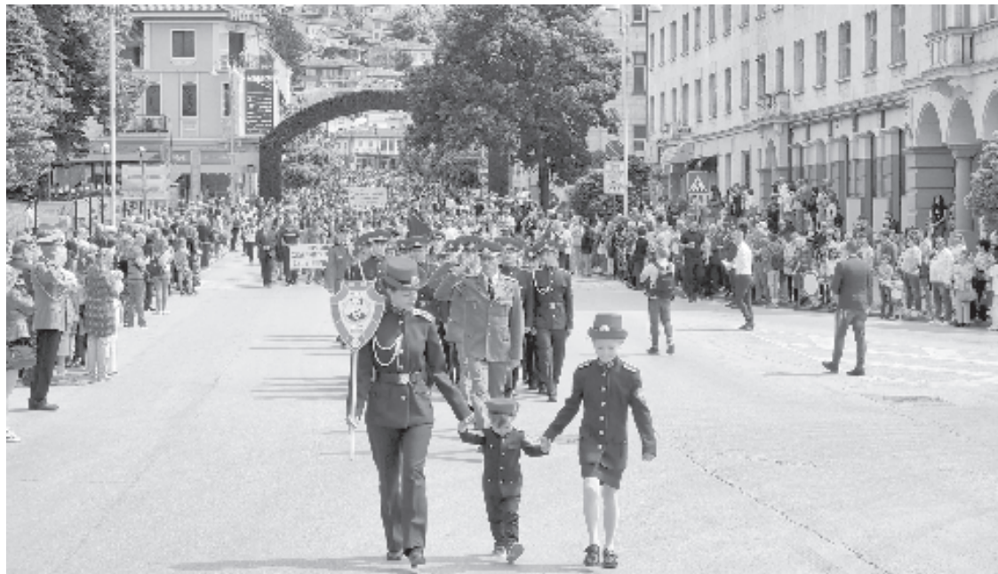
Централните улици на Велико Търново се оказаха тесни за стоклото се множество

Голямо шествие събра и пловдивчани, като то бе поведено от мажоретен състав при СУ "Св. св. Кирил и Методий", от духовия оркестър "Пловдив" и