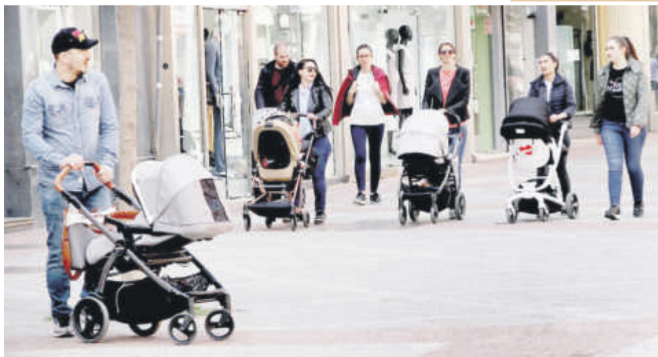
По-високите данъчни облекчения за семейства с деца са част от мерките, за които левицата настоява от години

■ Тази инфлация е драматична за някои семейства и хора, знаете това. Как ще отговорите на това обедняване и този страх у хората?