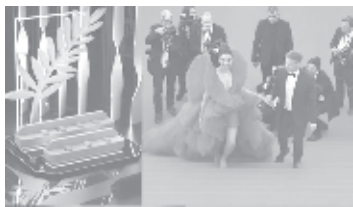
СНИМКА FESTIVAL DE CANNES 2022 © AFP

Прожекцията на зомби-комедия на френския режисьор Мишел Азанависиус „Final