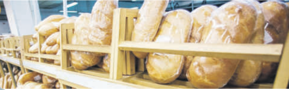
БСП отдавна настоява за нула процента ДДС за хляба

Това, че в момента помагаме, няма да има само краткосрочен ефект. Ако сега спасим икономиката и фирмите да не затворят, няма да бъдат освободени хора, няма да отиват повече обезщетения за безработица. Ако спасим икономиката и индустрията, работейки, тя ще води до добавена стойност. Ще ви дам пример с газа. 25 хиляди български фирми са зависими от доставката на газ. 260 хиляди души работят там. Ако не предприемем тази краткосрочна мярка сега - да покрием разликата, много голяма част от тези фирми ще фалират и ще затворят. Хората ще останат без работа - ето, това вече ще е дългосрочна катастрофа. Т.е. мерките, които сега предприемаме, имат визия да запазим икономиката и да се развиваме.