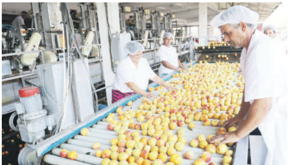
Подкрепата за българското производство е приоритет за БСП

Иначе - рейтинги лични или на правителството - да, следим ги, но важно е да си свършим работата. Да успокоим инфлацията, да дадем на хората спокойствие, да компенсирате доходите и да вървим напред.