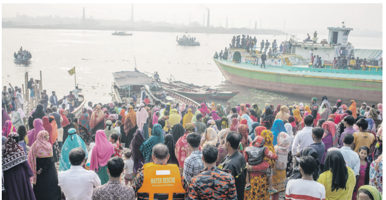
След сблъсък на катер и риболовен кораб в бангалдешката река Джалешвари 12 човека са обявени за издирване. Роднините им наблюдават спасителната акция от брега

Един от последните подобни тестове бе през октомври миналата година. Тогава КНДР призова своите 1,2 милиона войници да се обединят зад вожд Ким Чен Ун и да го защитят с живота си, докато страната празнува 10-ата годишнина от издигането на Ким за върховен главнокомандващ на армията.