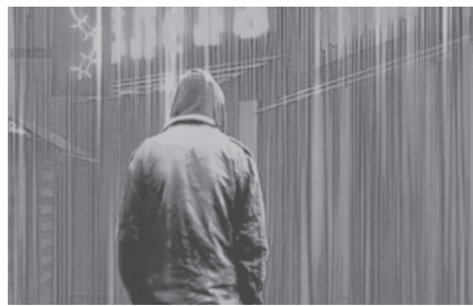
Според експерти разработката надхвърля всичко, познато досега