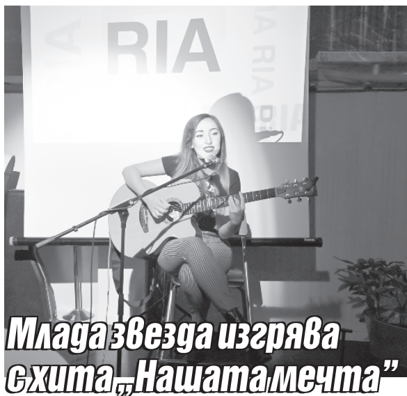
Млада звезда изгрива хита „Нашата мечта“

Кауза.бг предлага възможност всеки да популяризира обществено значимата си идея или да подкрепи такава според възможностите си. Но творческото вдъхновение не е достатъчна причина добрата кауза да намери място на платформата. Необходим е набор от задължителни документи, които да гарантират безупречна обосновка и финансов контрол за всеки етап от кампанията. А сподвижниците на каузата имат възможност да следят онлайн какъв процент от сумата, която се изплаща след края на обявения срок, е събран.