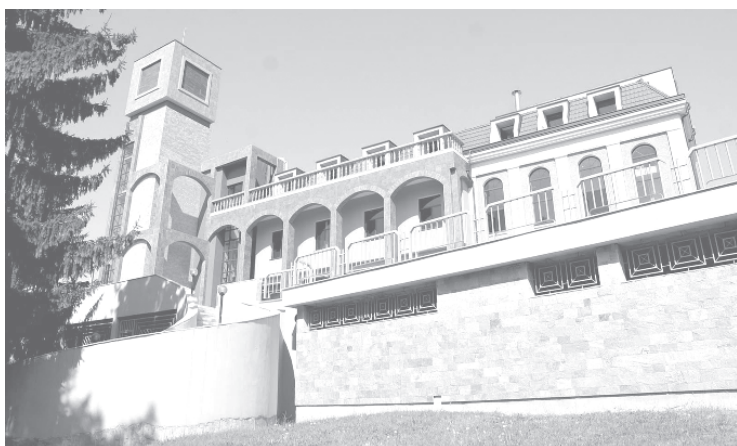
НЧ „Св. св. Кирил и Методий - 1882“ в Попово

Целта на фестивала е да събере и представи най-интересната и значима продукция, създадена от непрофесионални кинолюбители по определена тематика. Той стимулира нестандартния подход при изграждането на