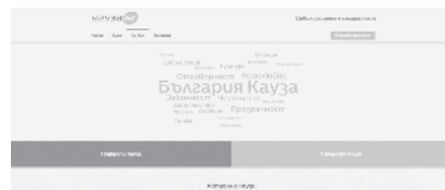
Дарителският сайт предлага възможност всеки да популяризира обществено значимата си идея

Платформата за споделени проекти с непреходна стойност - Кауза.бг, е поредното доказателство за несломимото желание за добротворчество и патриотични дела, убедени са от НДФ. И уточняват, че в нея всеки може да сподели напълно безкористно своята идея, да я развие сред съми-