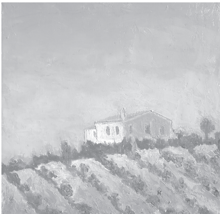
„Къщата в маслиновата горичка“