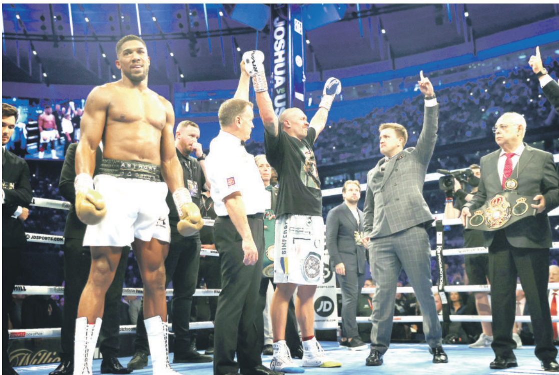
Олександър Усик е с вдигнати ръце, след като победи по точки Антъни Джошуа (вляво) в Лондон и му отне поясите в тежка категория

В договора на двамата обаче има задължителна клауза за незабавен реванш, която се активира при загуба на АJ, който е спечелил 20 от 22-те си победи с нокаут и досега имаше само едно поражение - от Анди Руис-младши (САЩ). Усик е без загуба на профиринга в 19 боя (13 нокаута). И двамата са олимпийски шампиони от Лондон