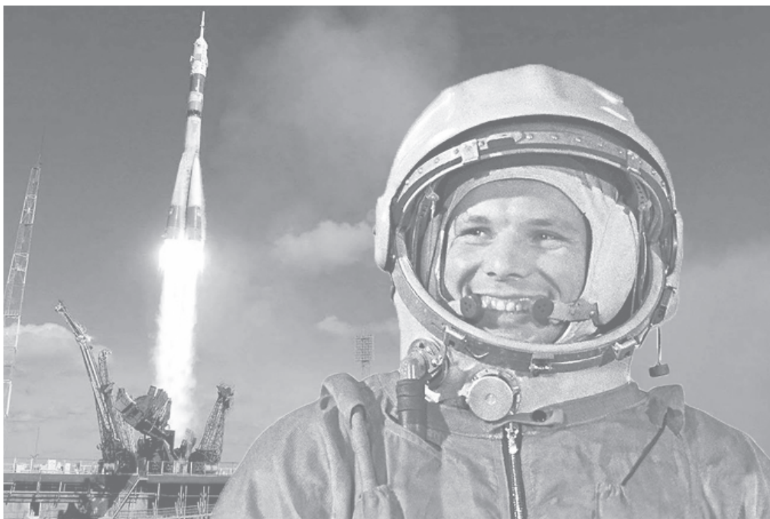
Първият полет в Космоса на СССР и страхът от превъзходството му кара Западът да преосмисли своята политика

на държавния социализъм в Съюза на съветските социалистически републики (СССР) и останалите европейски страни с това общественно-политическо устройство, които биха спукали пропагандния дирижабъл, акостиращ от телевизия в теле-