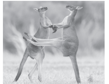
Един от кадрите, стигнали до финала

Най-забавните снимки на животни от дивата природа ще бъдат избрани за шести път. Конкурсът Comedy Wildlife Photography Awards обявя финалистите в надпреварата. Журито разгледа над 7000 кандидатури и избра общо 46 произведения със смешни моменти от живота на животните.