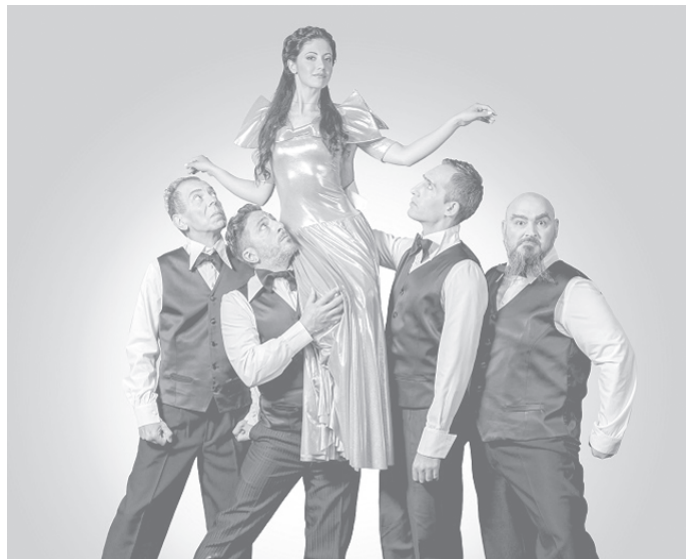
СНИМКА ТЕАТЪР "СОФИЯ"

хвърлят към надеждата, когато тя се появи, но се отказват миг преди да я постигнат, защото не вярват, че заслужават да бъдат щастливи. Възможен ли е друг финал? Отговора зрителите ще видят на 17 септември.