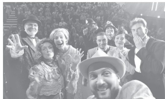
СНИМКА ТЕАТЪР "БЪЛГАРСКА АРМИЯ"

По традиция първите представления на Театър "Българска армия" съвпадат с Празника на София на 17 септември. Години наред на този ден отваряхме вратите на театъра за всички приятели и почитатели на театралното изкуство, които имат желание да надникнат и зад кули-