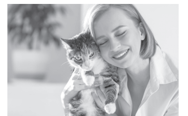
Емоционалната връзка между писаната и човека е изключително силна

Зоолози твърдят, че писани- те предпочитат да имат по-чес- то стопани жени, отколкото мъже. Въпреки че котките са сложни натури, дамите винаги са намирали по-бързо общ език с тях. Статистически доказано е, че слабият пол избира най- често котка за домашен люби- мец. Жените са по-емоционал- ни в отношенията с писаните -