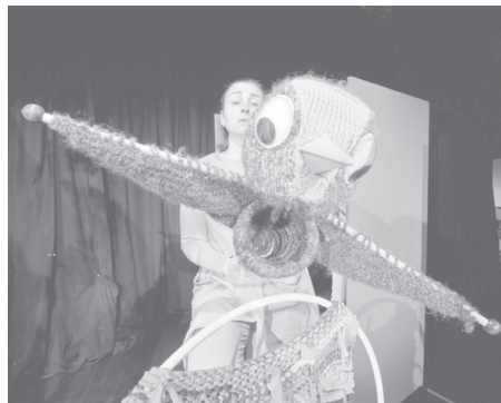
СНИМКИ СТОЛИЧЕН КУКЛЕН ТЕАТЪР

Зрителите, които поради ограничен брой места - до 30%, няма да могат да присъстват на премиерите, ще имат възможност да видят представлението на 3, 4, 10, 18 и 24 април - „Косе Босе”, и на 3, 4 и 18 април - „Малката Нула”. В програмата за април на ул. „Гурко” 14 са още „Боризмейко”