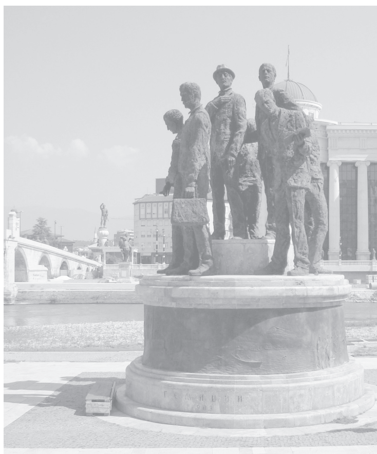
Паметникът на Солунските атентатори в Скопие