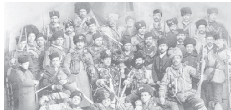
Комити от Македония в Илинденско-Преображенското въстание. Според Зоран Заев: "Илинденското въстание е македонско и ако някой гражданин от България иска, нека да го чества..."

... До преди повече от година време дейността на комитета имаше чисто български характер, те носеха българското знаме на освобождението, свои привърженици те намираха само сред ония, които са прегърнали българската народна идея. От нашите и от гръкоманите се чуждееха, даже се бояха и дори се предпазваха от тях с различни заплашвания. В