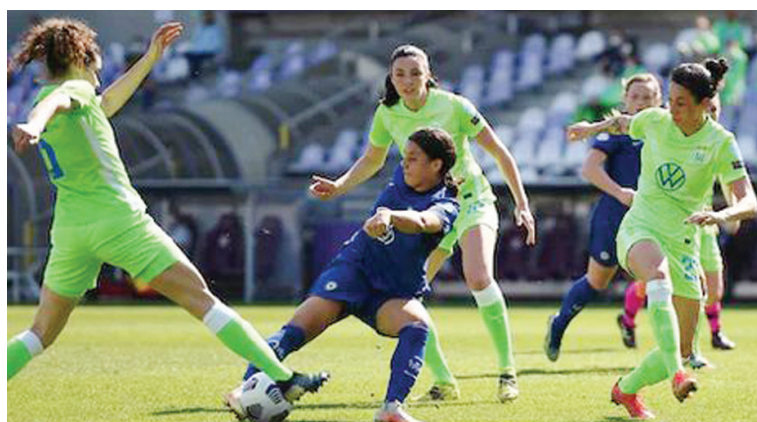
Саманта Кър се промъква между защитничките на Волфсбург, за да се разлише при победата на Челси с 3:0 в реванша от 1/4-финалите в Шампионската лига за жени, игран в Будапеща

Словенецът бе в Сърбия при семейството си по време на трите почивни дни, които даде на футболните след загубата от Локо Сф с 0:1 в контролата в неделя.